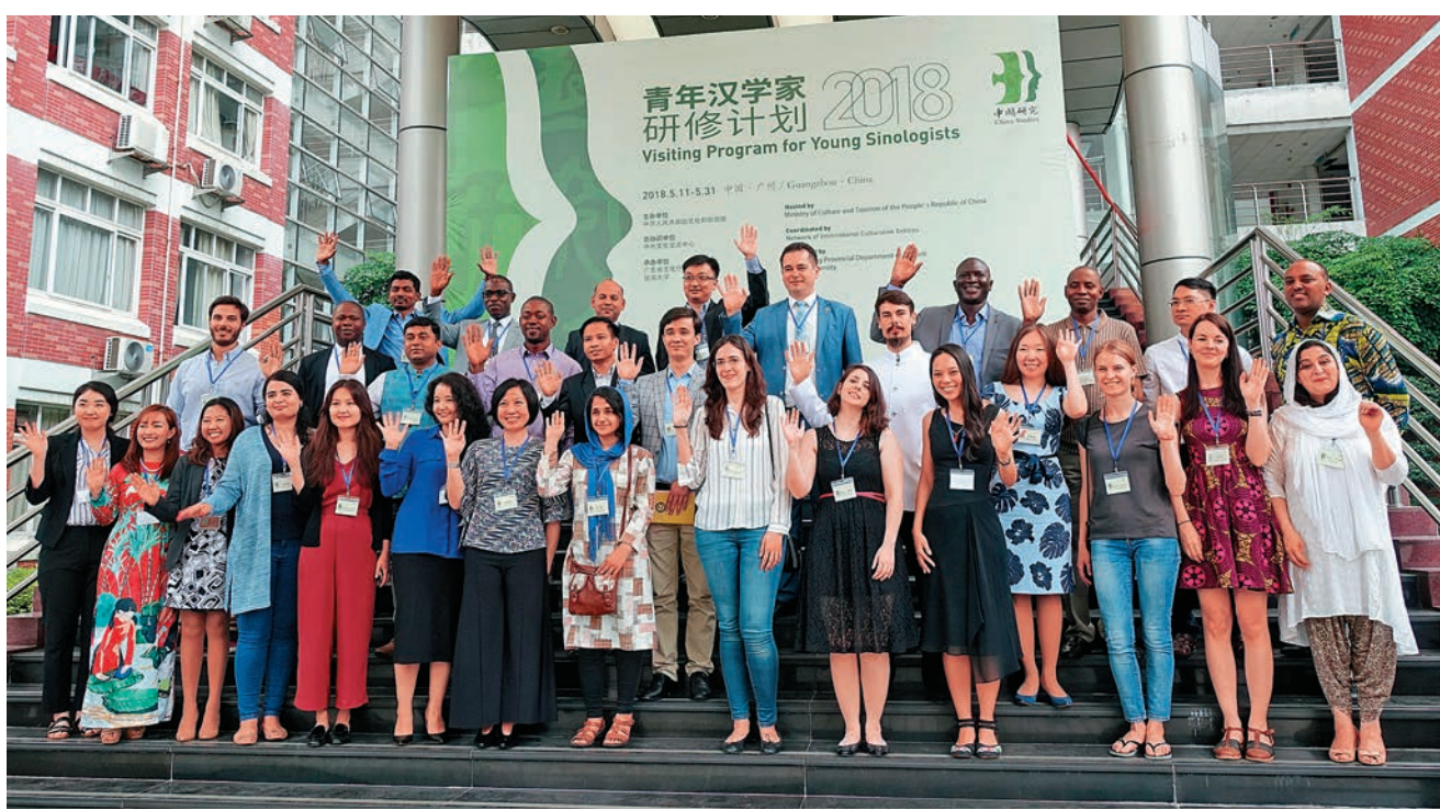
十二日，來自英國、俄羅斯、巴西等二十五個國家的三十一名優秀青年漢學家齊聚羊城，開展為期二十一天的研習活動。

據了解，自2014年啟動以來，青年漢學家研習計劃已經舉辦10期研習班，接待了來自81個國家的289位青年漢學家。