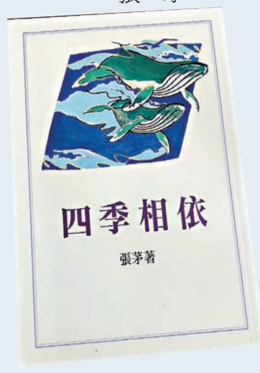
▲作者小品集《四季相依》