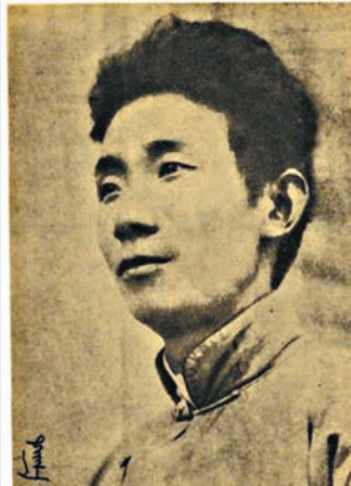
▲郁達夫的散文以小見大，以物狀人

情思是散文的靈魂，貴乎真，貴乎新意，貴乎深度。這一點，他認為關乎各人的氣質、稟賦和學養。第三，散文與社會變化關係密切，中外偉大作家透過藝術，融小我的哀樂於大我的休戚中，不可以不多閱世情，多觀物理，然後養成弘中肆外的散文藝術。