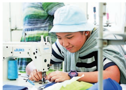
卓瑤曾經通宵一針一針縫紉媽媽袋