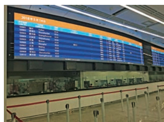
西九龍車站售票櫃位上方設有巨型電子屏幕

據昨日西九龍車站售票大堂現場所見，售票櫃位上方設有四個巨型電子屏幕，以顯示列車資訊，包括列車編號、目的地、發車時間、中途站、車務狀況和銷售情況等。當中，目的地英文名稱採用內地漢語拼音，如深圳北站為「Shenzhenbei」、廣州南「Guangzhouan」。