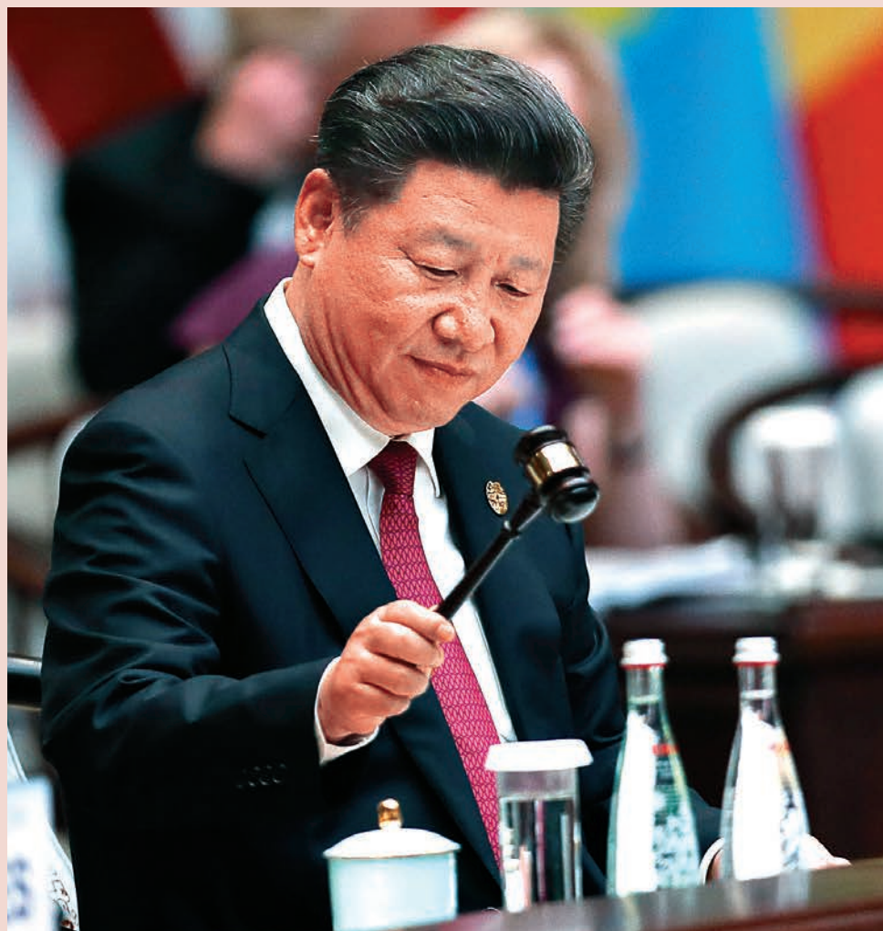
▲習近平強調，要開創中國特色大國外交新局面。圖爲2016年9月習近平在G20領導人杭州峰會上資料圖片