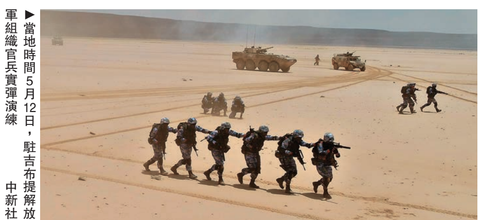
▲當地時間5月12日，駐吉布提保障基地官兵實彈演練。

據悉，此次演練，是該基地在吉布提熱季探索開展大強度實兵實裝實彈演練的又一次嘗試，全面拉動了作戰指揮、協同通信、後勤支援、裝備保障，挑戰了極限，磨練了意志，增強了解放軍官兵有效履行職責的信心和能力。