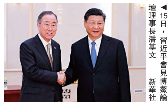
▲15日，習近平會見博鰲論壇理事長潘基文。

潘基文表示，感謝中國政府對博鰲亞洲論壇的大力支持。當前形勢下，論壇需要發出支持全球化、支持自由貿易的明確信息，要充分借助中方「一帶一路」倡議，推動亞洲實現更好發展。從長遠看，論壇要成爲一個促進世界人民和諧共處的重要平台，爲構建人類命運共同體作出努力。