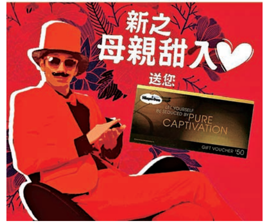
▲團隊於五月份為商場舉行一連串宣傳活動，當然少不了母親節優惠