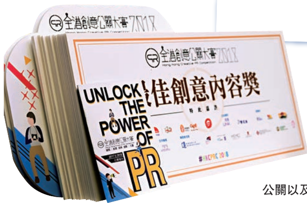
▲「全港創意公關大賽」為年輕人提供平台實踐理想，同時讓更多人了解什麼是公關以及公關的運作