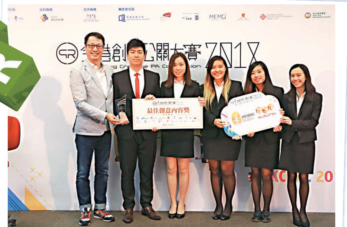
▲第二屆全港創意公關大賽，大專組銀獎由香港城市大學組成的「輕輕一推」奪得

思獲得評審青睞，並橫掃「最佳創意內容獎」、「優秀演繹大獎」及大專組別銀獎，成為終極大贏家，隊伍更獲贊助商新之城投放逾六位數把其構思的專案實行，五月份逢星期五、六，把商場打造成為旺角「夜市」，令學生喜出望外，同時為比賽注下強心針。