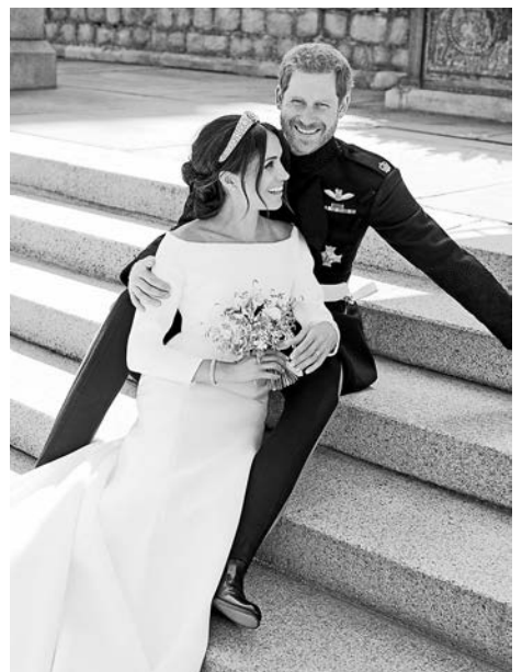
▲英王室公布的哈里和梅根的黑白婚照

【大公報訊】據英國《每日郵報》及《紐約時報》報道：英國肯辛頓宮於21日發布的三張哈梅大婚官方照片，獲英國身體語言專家詹姆斯大讚完美。