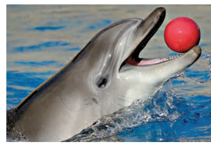
▲集智慧與忠誠於一身的海豚

對於近日頻傳的大部分海豚已經死亡的消息，克里米亞烏克蘭政府代表巴賓說，這些海豚到了俄羅斯後拒絕配合