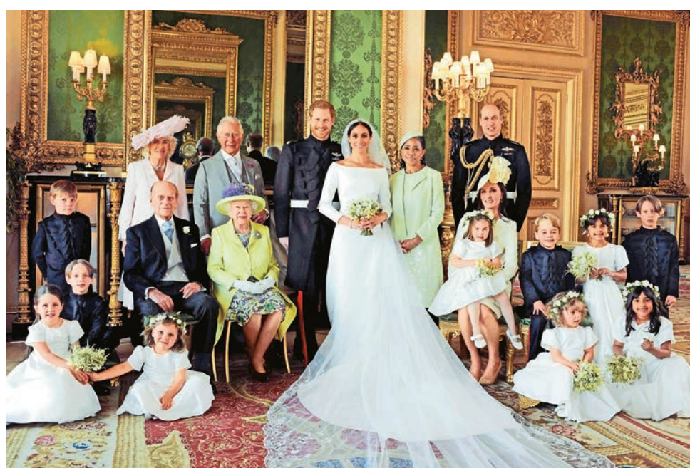
▲英王室公布的四世同堂全家福

三張官方照片均由著名人像攝影師魯波米爾斯基掌鏡，他也是兩人訂婚照的攝影師。他坦言，為哈梅拍攝的經歷是他職業生涯裏最動人的篇章。