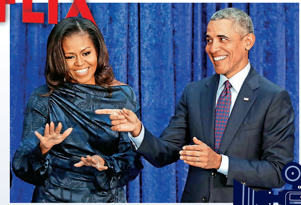
▲美國前總統奧巴馬（右）和夫人米歇爾（左） 資料圖片

出書與演講是大部分美國總統卸任後的經濟來源。奧巴馬自去年1月卸任以來，先和妻子米歇爾一起與企鵝蘭登書屋簽訂了回憶錄的出版協議，協議金額高達6500萬美元（