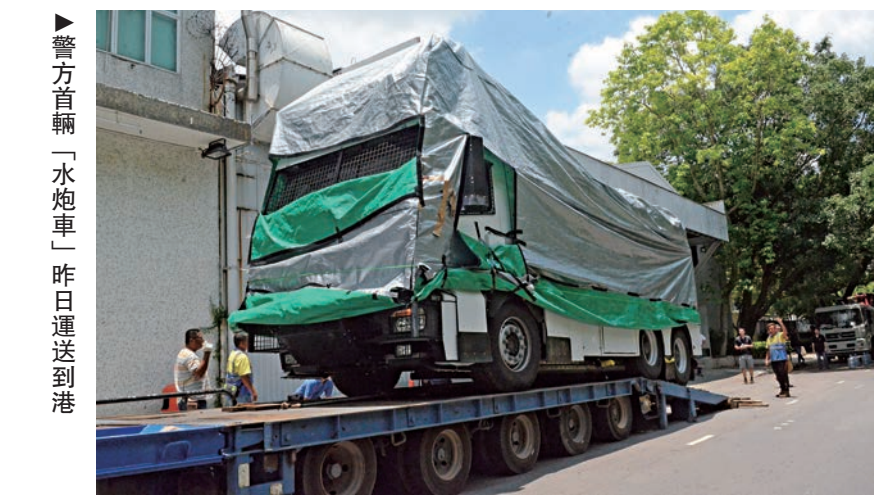
警方首輛「水炮車」昨日運送到港

警方表示，會為該特別用途車制訂嚴格的守則及操作指引，生產商亦會派工程師到港為人員提供訓練；警方強調，所有操作人員在使用該車輛前必須接受訓練，並嚴格遵守相關守則及操作指引。據了解，水炮車日後停放於粉嶺機動部隊總部，主要由機動部隊人員使用。