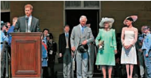
▲哈里（左一）和梅根（右一）婚後首次參加王室活動

期將會先著手於女權主義的公益事業。20日英國王室官方網站公布的梅根個人介紹中，也包含了梅根對女權主義者身份的自述，表示「很驕傲身為一名女性兼女權主義者」。派對同時也邀請了一年前在曼徹斯特演唱會恐襲中率先趕到現場的急救人員參加。