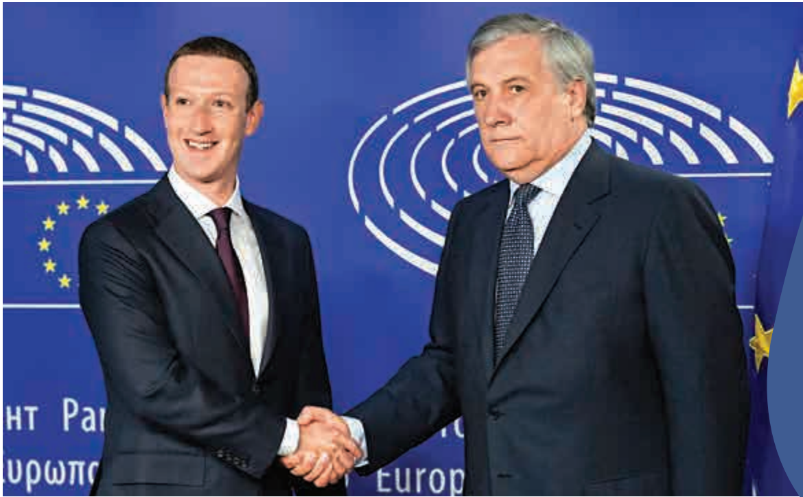
▲塔亞尼（右）22日與朱克伯格會面