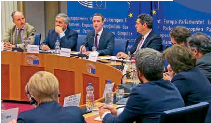
◀朱克伯格（左三）在歐洲議會接受質詢

朱克伯格發言結束後隨即開始接受議員質詢。有議員質疑，Fb在過去十年幾乎年年犯錯，因此朱克伯格經常公開致歉，十年中道歉不下十五六次如「編年史」，且每次道歉後均保證實施改