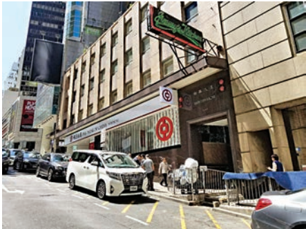
▲今天的南華大廈，曾是《南華早報》總部

追尋雲咸街的過去，發現昔日的故事，可先從雲咸街口中匯大廈出發。百多年來，香港文化的肇始興衰，從報刊到圖