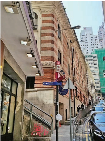
▲藝穗會會址位於中環下亞厘畢道和雲咸街交界，稱為舊牛奶公司倉庫

1983年，港英政府讓藝穗會租用牛奶公司的冷庫，其運作的靈活性，令原址得以浴火重生。今天藝穗會積極發展為本地