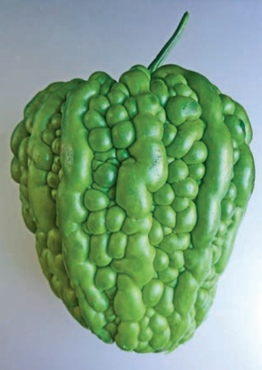
◀「雷公鑿」是苦瓜的一個品種，看着不難想像「擱埋口面」時有多難看