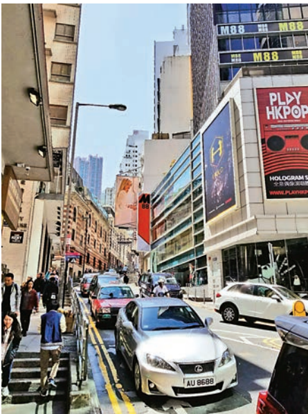
▲作者帶領學生追尋雲咸街的過去，發現昔日故事

藝穗會（The Fringe Club）會址位於中環下亞厘畢道和雲咸街交界，近雪廠街，稱為舊牛奶公司倉庫，是香港其中一座具歷史及文化價值的文物古蹟，是雲咸街百年變遷的目擊者，其獨特的建築風格吸