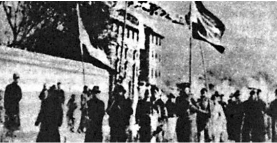
▼五四運動期間群眾上街遊行，「外爭國權、內懲國賊」，反對西方列強無理決定和北洋軍閥政府的妥協政策 資料圖片