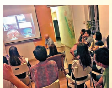
▲香港飛碟學會不時舉辦講座，討論外星生命等問題 網上圖片