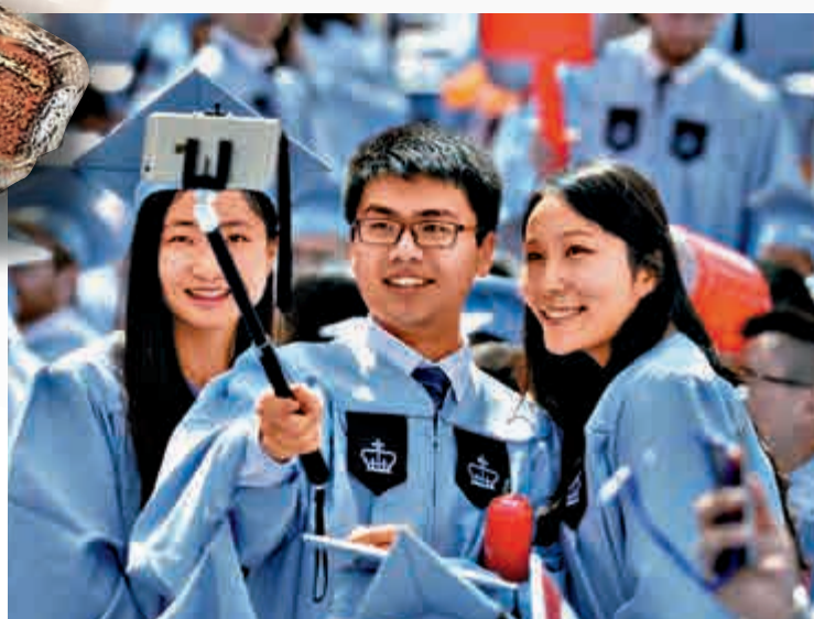
▲2015年，中國留學生在哥倫比亞大學出席畢業典禮