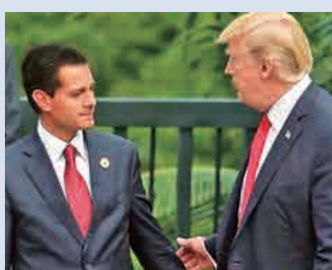
▲2017年11月，培尼亞(左)與特朗普在APEC峰會會面

【大公報訊】據路透社報道：美國總統特朗普上任前後，主張在美國與墨西哥邊境建牆，並要墨西哥買單。特朗普29日再提此事，墨西哥總統培尼亞直接反駁「現在和將來絕不付錢」。