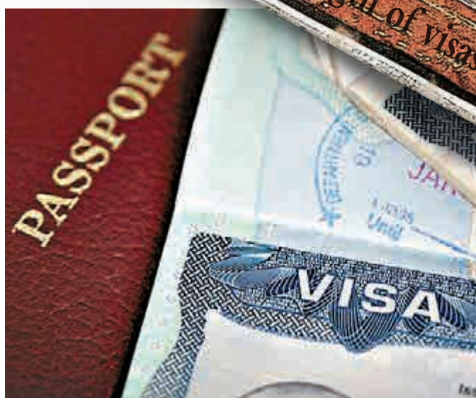
▲美國計劃縮短部分中國留學生簽證有效期