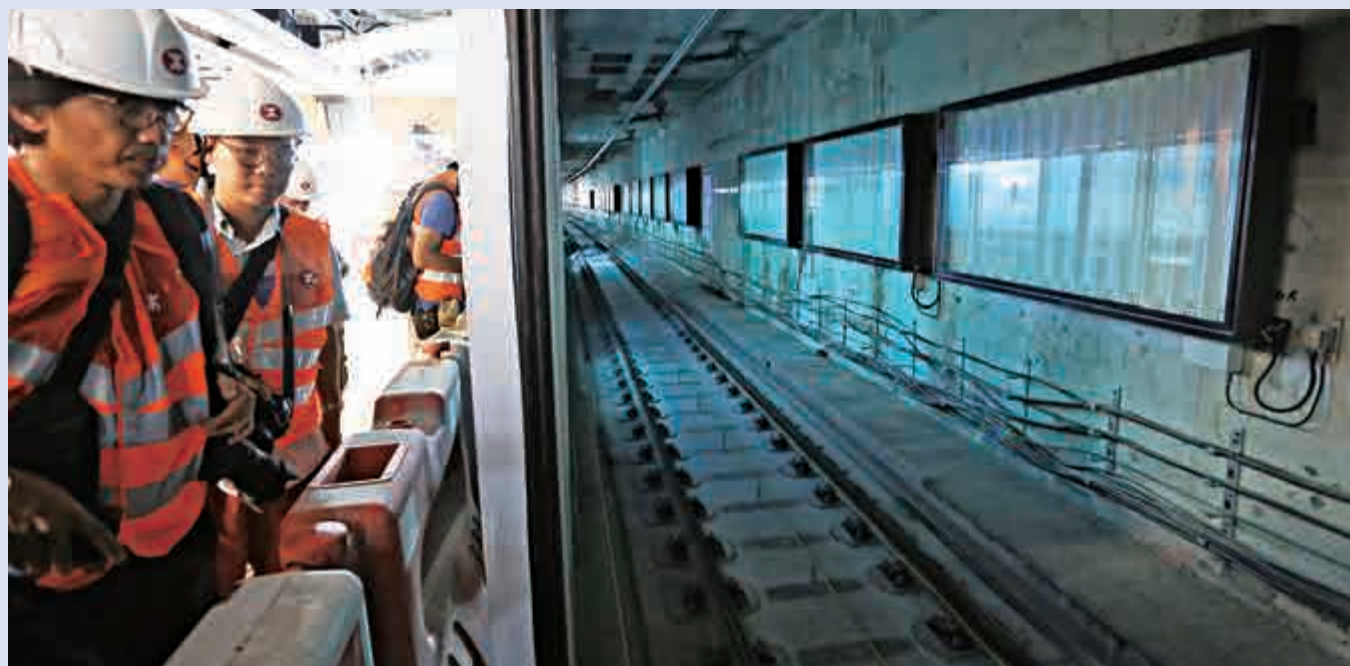
▲港鐵承認，新建月台層板與牆身接駁位的鋼筋施工曾發現不合標準，但已即時要求承建商糾正，強調現行監管有效