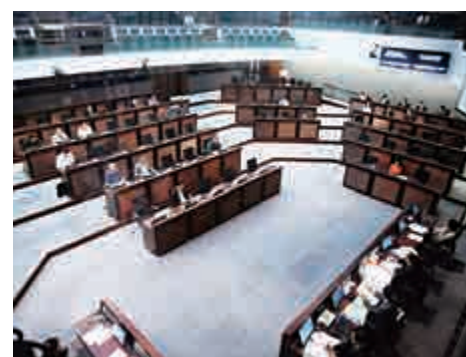
▲立法會將於七月暑假休會，但仍有大量工務工程及項目撥款「塞車」

特首林鄭月娥日前表示，對目前立法會的撥款進度感樂觀，相信可趕及在暑假前通過所有民生相關及具迫切性項目，預料在今個立法年度批出的基本工程撥款總額將達1700億元，是近五年新高，比2016/17年度的555億元大幅增加。