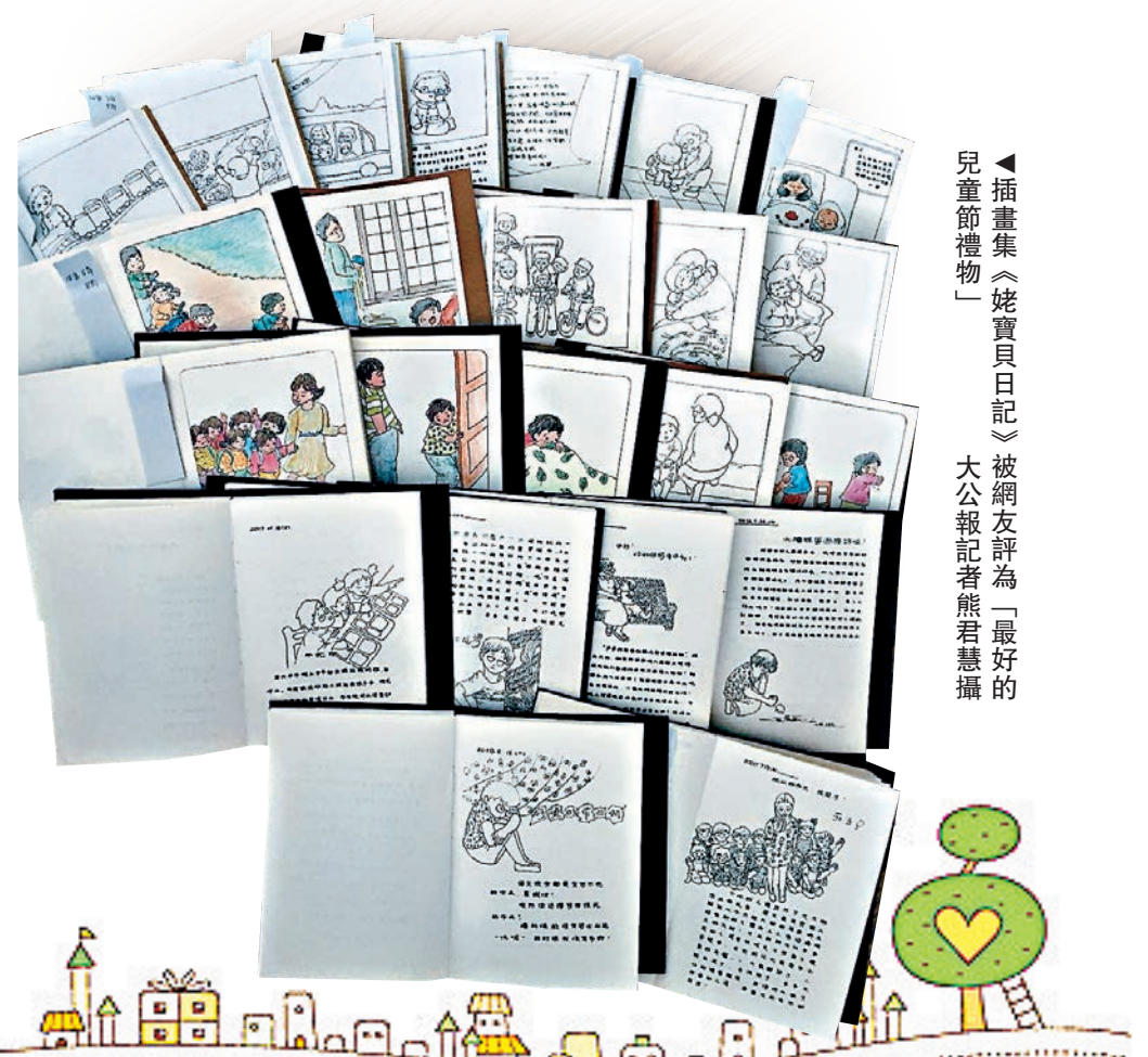
▲插畫集《姥寶貝日記》被網友評為「最好的兒童節禮物」。