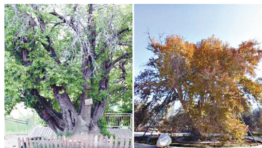
▲新疆兩棵古樹成為「最美新疆野蘋果」（左）及「最美三球懸鈴木」。

而「最美三球懸鈴木」位於和田地區墨玉縣阿克薩拉依鄉古勒巴格村，樹齡882歲，雖已是接近千年的古樹，但依然枝繁葉茂，生機盎然。這棵古懸鈴木高34.8米，從主幹派生出七大枝幹伸向四周，競相媲美。（記者 應江洪）