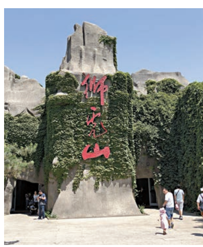
▲中國首個動物藝術專題展將在北京動物園獅虎山開展。

據介紹，該展區的開幕展覽以《對話》為題，共展出近30位藝術家的作品。未來，展區將常年舉辦公益主題展覽，作品範疇包括動物主題的畫作、雕塑、設計、攝影等，讓民眾通過藝術作品去進一步了解動物與大自然。（記者 江鑫嫻）