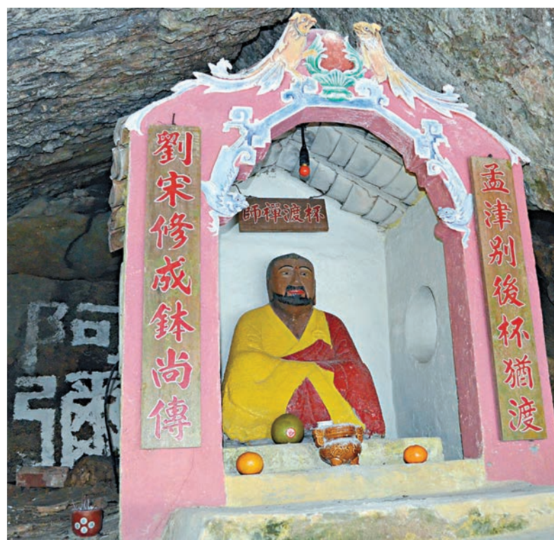
▲屯門青山寺的杯渡禪師雕像

古代香港居民以漁農為業，其中少數望族仍然堅守詩禮傳家的祖訓，十分重視族中子弟的教育。新界望族鄧族的祖先鄧符協是北宋熙寧年間（1068-1077）進士，嘉慶《新安縣志》卷四《山水略》記載了鄧符協在桂角山下築力瀛書院講學的雅事，並說該書院「基址猶存」。力瀛書院的創設比廣州禺山書院、番山書院等廣東著名書院還要早一百多年，可見香港的早期發展並非全為簡單的漁村農村面貌，其中不乏有識之士興學育才，不甘與中國文化制度脫節。錦田的鄧文蔚曾考中進士，在康熙二十四年（1685年）乙丑科會試中式第68名。他曾參與康熙二十七年《新安縣志》的編纂，是本地子弟學以致用的表率。