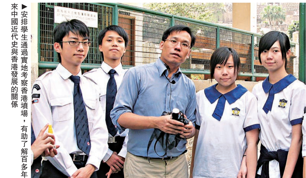
▲安排學生通過實地考察香港墳場，有助了解百多年來中國近代史與香港發展的關係

最後，我建議老師在考察前，先閱讀丁新豹的《跑馬地香港墳場初探》，自然會發現大量有助考察活動的歷史資料。