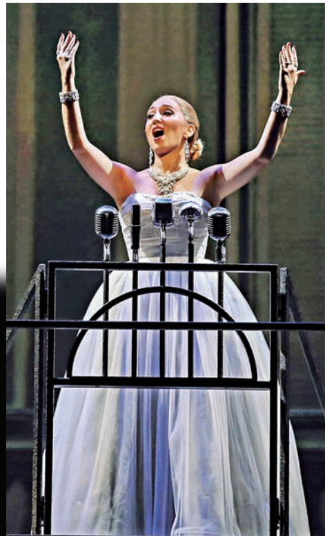
▶愛瑪·瓊斯頓主演貝隆夫人