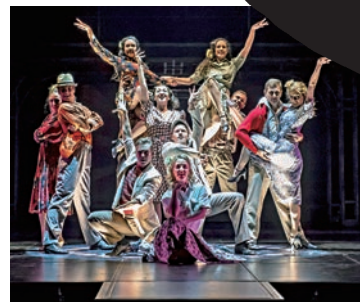
▲夜總會裏的歌舞場面