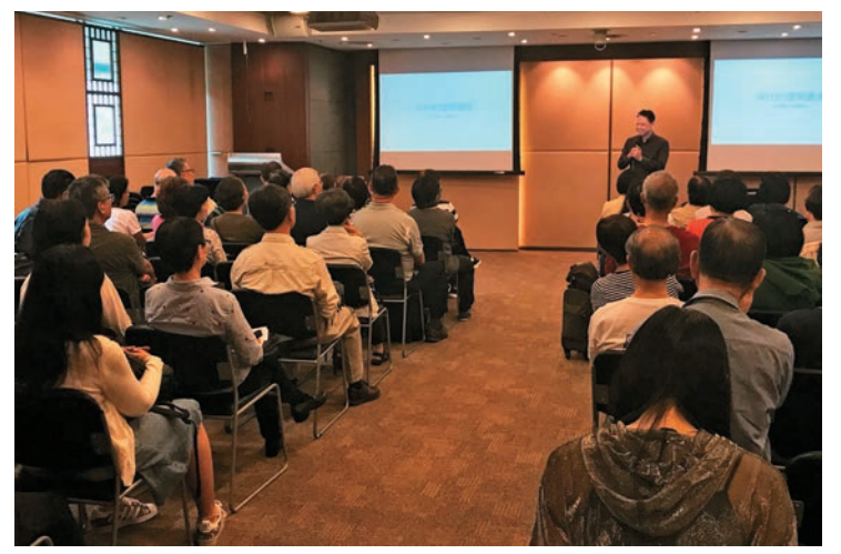
◀「從清明上河圖說起——宋代留給我們的建築遺產」講座，不少市民參加