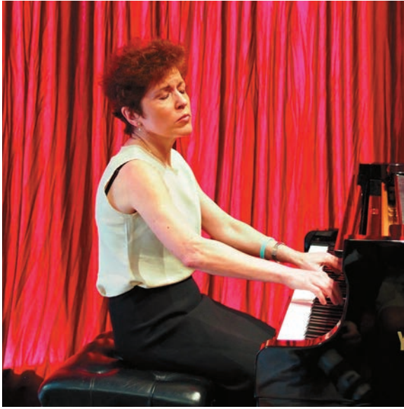
▲奧爾嘉·芭伯洛夫妮可娃（Olga Bobrovnikova）爲俄羅斯鋼琴家，常到世界各地表演參與有關腦神經研究及多發性硬化症的慈善活動