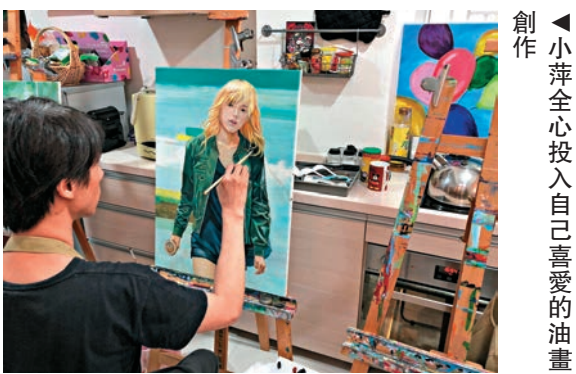
▲小萍全心投入自己喜愛的油畫創作