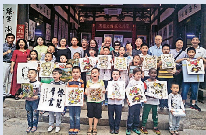
文、圖：大公報記者 蘇榕蓉

6月1日上午，福建省福州市文儒坊南街藝術館內孩子們歡歌笑語，洋溢着節日的喜慶氣氛。逾20名外國、中國和華人兒童，齊聚此間書畫聯誼，歡度六一國際兒童節。