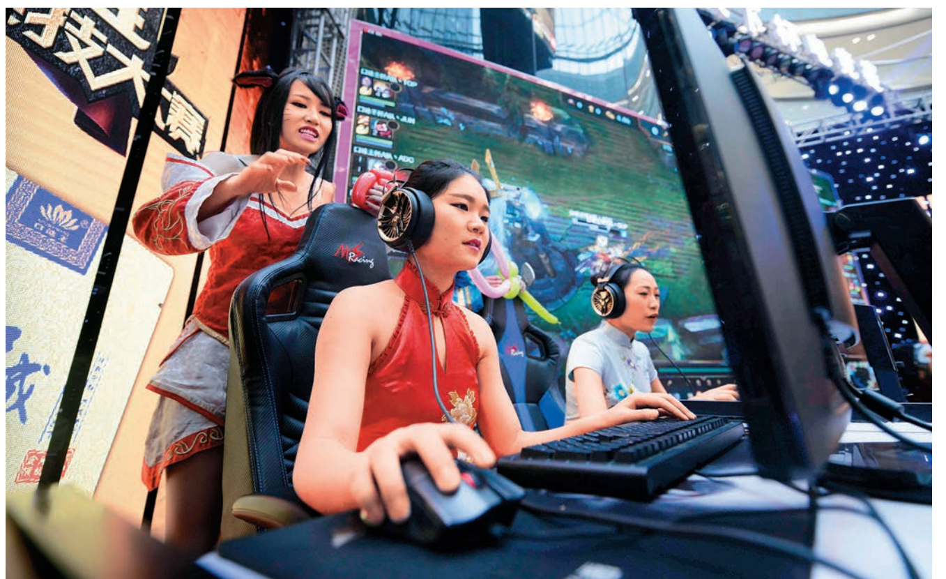
▲首個騰訊電競運動城市落地珠海。圖為內地電競比賽總決賽現場