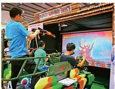
▲多個香港財團北上開展跨界合作，搶灘電競、遊戲等市場

同時，香港英皇娛樂集團亦搶灘電競領域，開展電競專業課程。據了解，課程邀請海外及內地教授、香港電競總會專業人士等作講師，講解全球電競生態、遊戲商如何營運等。而課程也與內地公司合