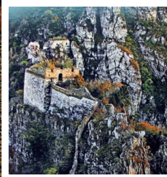
▲北京懷柔縣「箭扣」長城