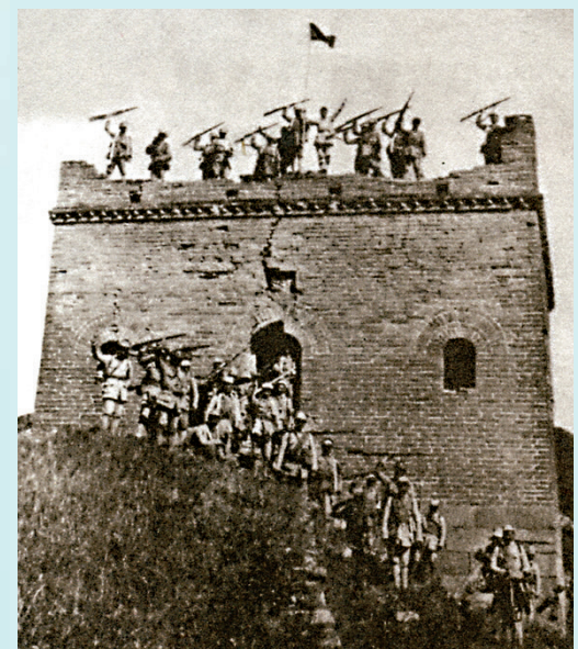
▲抗日戰爭時期一九四〇年「百團大戰」，八路軍戰士在涿源東團堡長城烽火台上歡呼勝利

到上世紀三十年代日寇發動「九一八」事變後，日軍很快轉向進攻熱河、察哈爾省一帶，力圖先佔領長城北部地方，再攻破薊鎮、宣鎮長城防線，直逼華北、中原，長城又成為中華民族抵禦日本帝國主義侵略的防線。在承德失守後，在義院口、界河口、青山口、喜峰口、鐵門關、羅文峪、冷口、古北口、多倫、張家口等一百多個長城關口、蜿蜒一千多里的長城沿線，中國守軍嚴陣以待。一九三三年三至五月，展開了著名的「長城抗戰」。當時在古北口、喜峰口等地，敵人炮轟長城上的