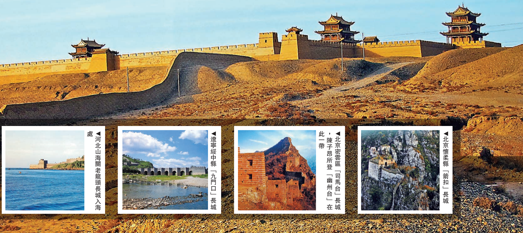
▼萬里長城最西端嘉峪關