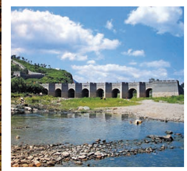
▲遼寧經縣「九門口」長城