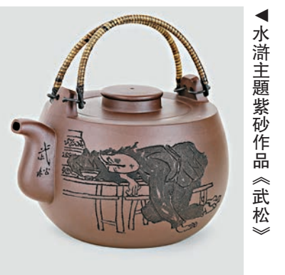
▲水滸主題紫砂作品《武松》