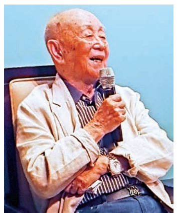
▲黃永玉笑談自己的藝術創作

【大公報訊】記者張寶嶸北京報導：黃永玉這位縱橫書、畫、刻、文、樂多領域的藝術家，以其樂活不羈的風格為文作畫，演繹出鮮活浪漫的藝術生命力。黃永玉近日在北京中國美術館再次帶來自己全新的創作實驗——紫砂水滸人物展。一個個活靈活現的英雄好漢，一段段耳熟能詳的經典故事，悉數被黃老搬上了紫砂壺。