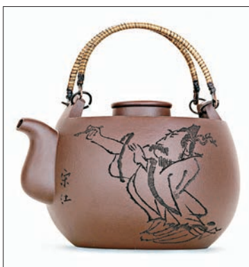
▲水滸主題紫砂作品《宋江》