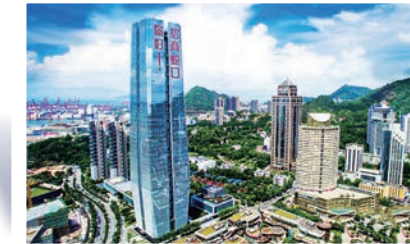
◀如今的大南山腳下，街道乾淨，道路規劃有序，招商蛇口大樓與香港隔海相望 網絡圖片