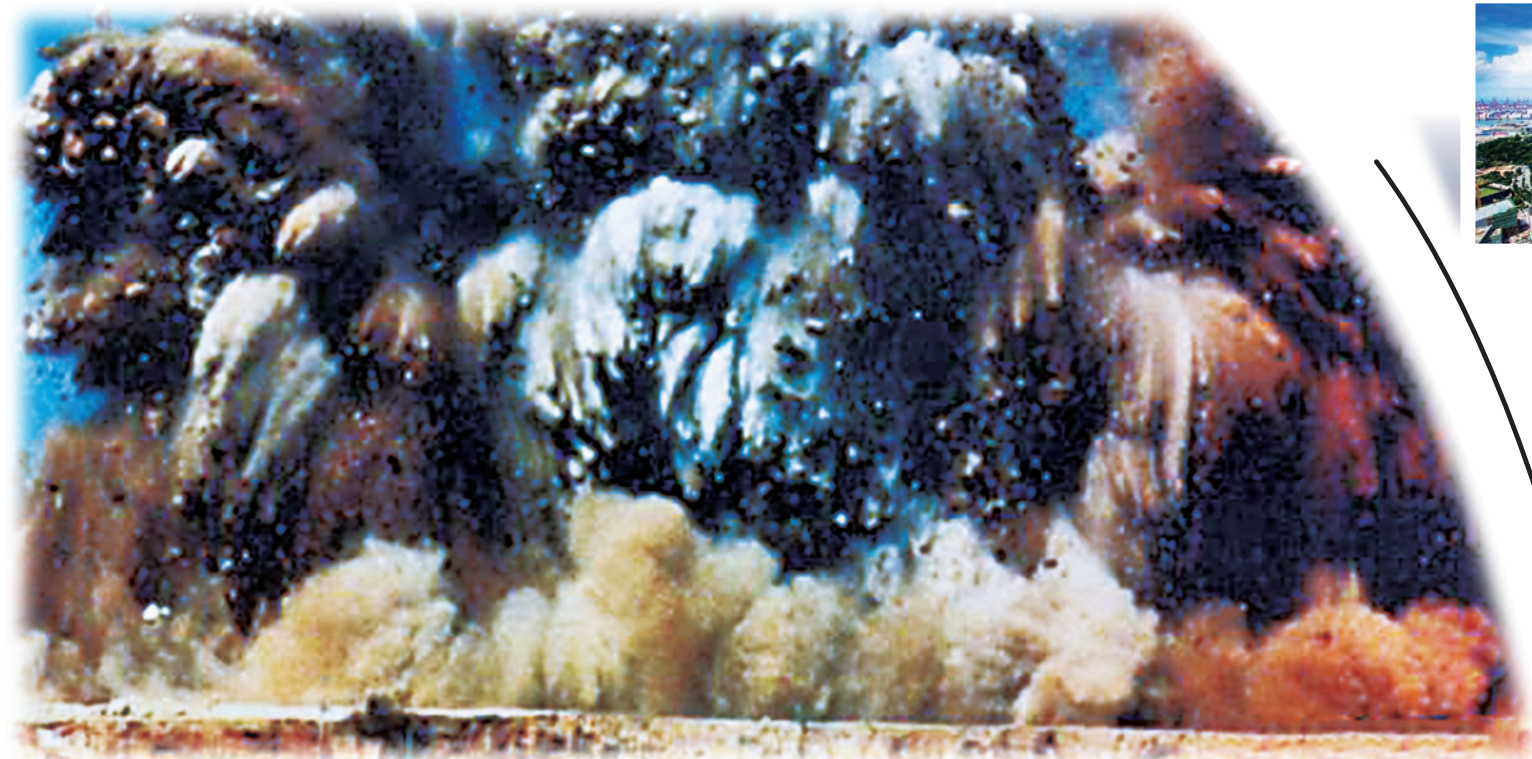
▲一九七九年七月，蛇口響起填海建港開山炮