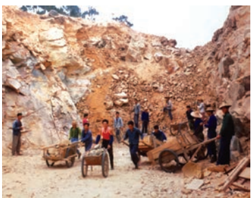
◀蛇口首推超產獎勵制度，工人幹勁十足

事態的嚴重性，1980年5月，蛇口工業區建設指揮部向交通部、國務院進出口管理委員會、廣東省委特區管理委員會遞呈《關於蛇口工業區特區基本建設按經濟規律辦事實行定額計酬辦法的請示報告》並附上相關調查報告，不到兩個星期，一份《關於深圳市蛇口工業區碼頭工程停止實行超產獎，造成延誤工期，影響外商投資建廠》的新華社國內動態清樣（第20687號）得到時任中共中央總書記胡耀邦的清樣批字，定額超產獎勵制度才得以重生。