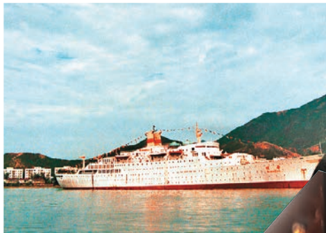
▲1983年11月停泊在蛇口海濱的明華輪局部開業 資料圖片