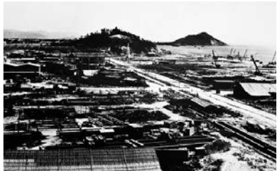
▲80年代建設初期的蛇口港 資料圖片

1979年7月，蛇口填海建港的開山炮轟然響起，這是深圳經濟特區建設的第一炮，更是中國改革開放的第一炮。從此，蛇口和一個大時代緊緊聯繫在一起，作為中國改革開放的排頭兵，為中國的改革開放探索提供了寶貴經驗。從1979到1984，蛇口這個改革開放的「試管」創造了24項全國第一，正是這些「第一」，沉澱成為今天市場經濟的常態。40年過去了，這裏成為名企的出發地，走出了平安保險、招商銀行、中集集團、萬科、華為等響噹噹的企業，這裏曾是小漁村現蝶變為大都市，蛇口用飛快發展的速度演繹着改革開放的廣東奇跡。