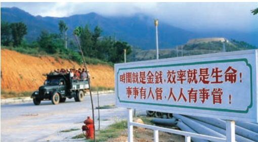
▲蛇口提出的「時間就是金錢，效率就是生命」口號人盡皆知，是改革開放40年來的時代強音

1981年年底，袁庚提出「時間就是金錢，效率就是生命」，這句後來家喻戶曉、更成為了改革開放40年來知名度最高的口號，當時不