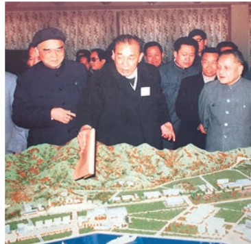
▲1984年，袁庚向鄧小平匯報蛇口建設進展 資料圖片