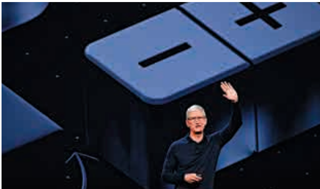
▲蘋果行政總裁庫克在開發者大會演講