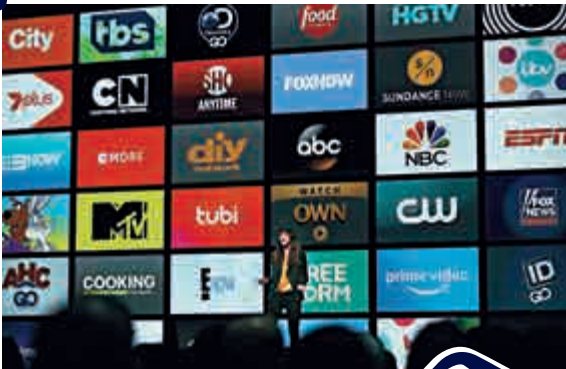
▲APPLE TV資深設計師福爾斯（Jen Folse）在大會上演示

近年來，受制於技術開發瓶頸，蘋果已經逐漸將重心由硬件轉移到軟件，蘋果在互聯網服務業務收入同比增長超過了30%。據悉，蘋果在過去12個月裏，市場銷售增加了23%，僅在6月的頭兩天，銷售亦有2.7個增長點，令投資人對其充滿信心。