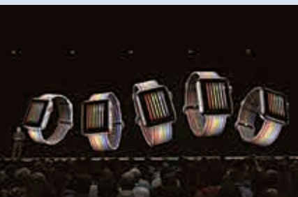
▲蘋果手表的彩虹主題表帶及表面

蘋果新款手表預料今年秋季推出，提供Apple Watch Series 1及後續機種免費更新，搭配手機需為安裝iOS 12系統的iPhone 5s或後續機型。