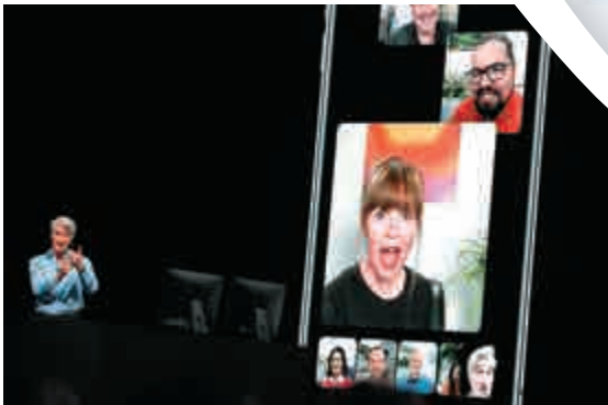
▲蘋果軟件工程資深副總裁費德里吉現場演示多人視頻