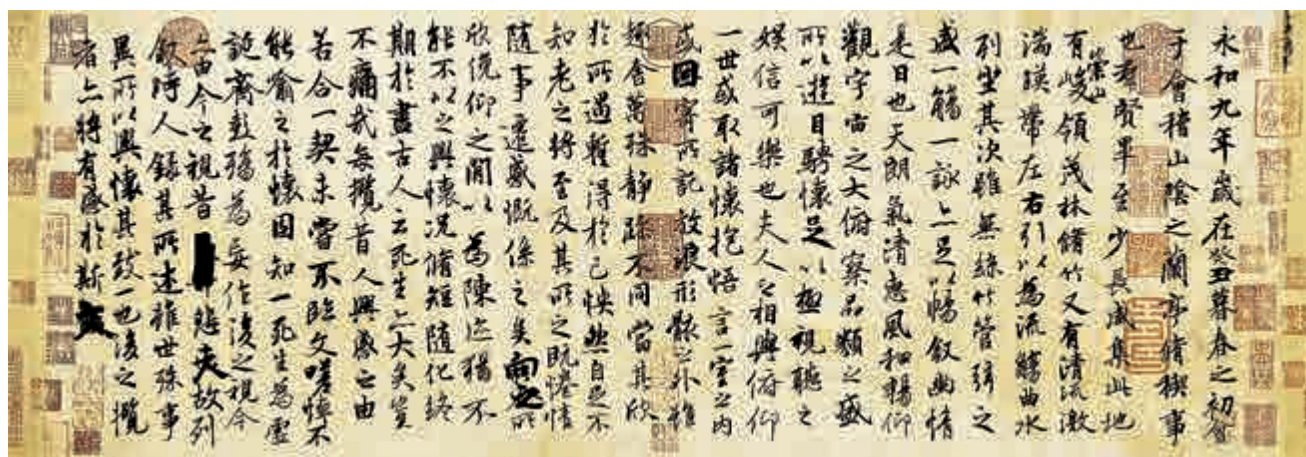
▲唐馮承素摹王羲之《蘭亭敘帖》