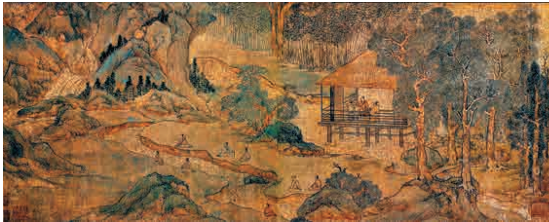
▲明文徵明《蘭亭修禊圖》(局部)