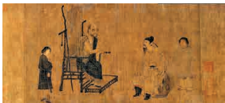
▲南宋摹唐閻立本《蕭翼賺蘭亭圖》