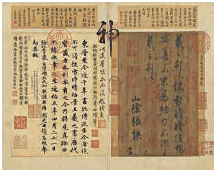
▲王羲之《快雪時晴帖》