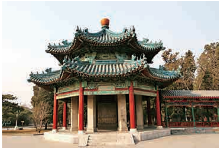
▲北京中山公園「蘭亭八柱」亭