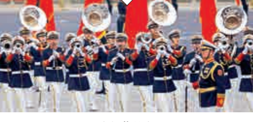
軍樂團行進隊列換裝，吹奏表演隊形重新編排