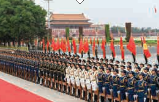
三軍儀仗隊人數有所增加，首次設立女兵方陣