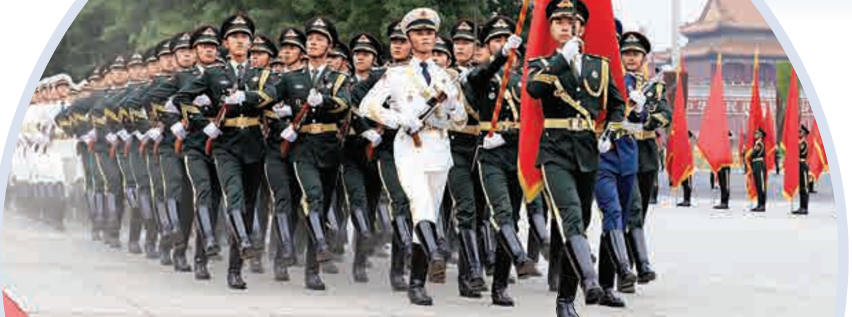
◀6月6日在歡迎儀式上拍攝的三軍儀仗隊

1980年9月起，歡迎儀式改在人民大會堂東門外廣場舉行。冬季或遇到雨雪大風天氣，則在人民大會堂室內舉行。