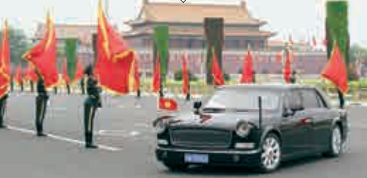
在中國國家主席（夫婦）出大會堂東門時，演奏儀式號角

外國元首抵達變換路線，增設手持紅旗儀仗兵 在中國國家主席（夫婦）出大會堂東門時，演奏儀式號角 三軍儀仗隊人數有所增加，首次設立女兵方陣 軍樂團行進隊列換裝，吹奏表演隊形重新編排