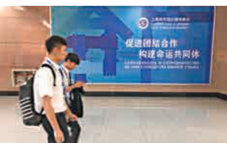
▲青島流亭機場張貼的上合標語

組織青島峰會一道獨特的風景線。在一個具有現代設計感的大廣告牌上，「推動上合組織發展，建設新型國際關係」大字格外醒目，一旁的「合」字不僅突出了中國負責任大國形象，更闡釋了中國願意與世界其他國家攜手，構建人類命運共同體，合作贏得美好未來的理念。（記者 李理）