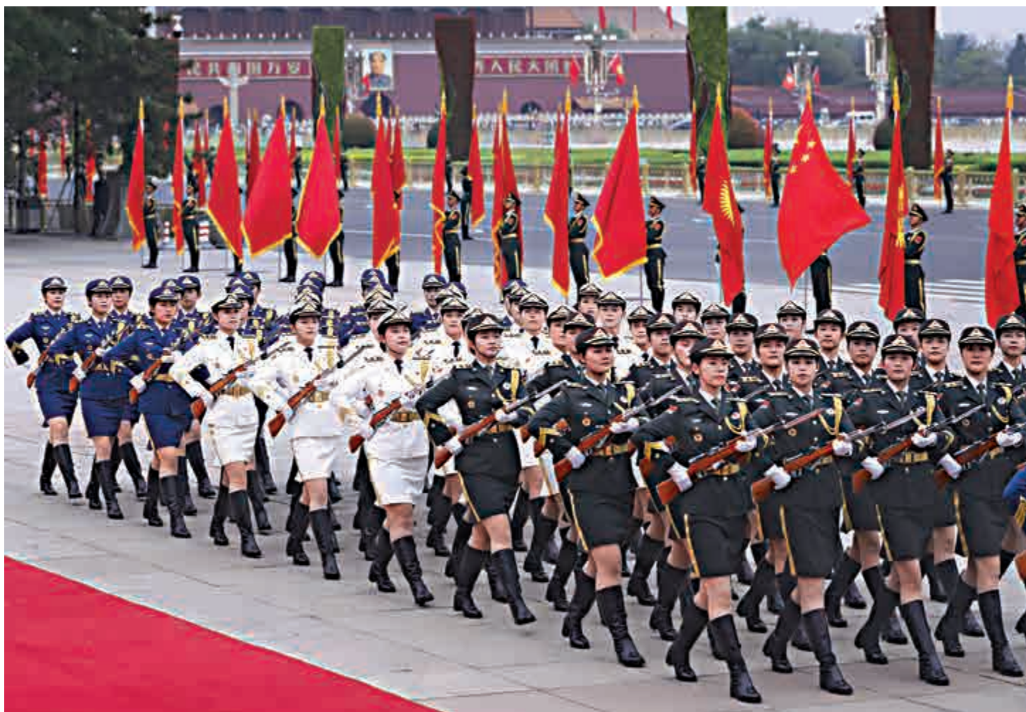
▲改革後的國事訪問歡迎儀式6月6日首次啟用。圖為三軍儀仗隊首次增加女兵方陣

禮賓工作是國家形象的名片，世界上眾多國家都非常重視歡迎儀式的設計安排。中共十八大以來，習近平主席出訪期間，往訪國經常打破慣例，給予特殊禮遇，舉行盛大歡迎儀式。隨着中國日益走近世界舞台中央，國家典禮工作有必要更好地與中國特色大國外交相適應，此次改革就是一次重要實踐。