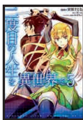
▲被全面下架的《在異世界開拓第二人生》海報 網上圖片