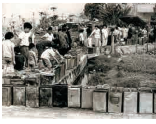
▲上世紀六十年代香港飽受旱災之苦，圖為九龍石硤尾居民在烈日下輪候淡水