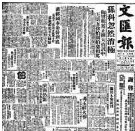
▲書中刊登香港《文匯報》創刊號