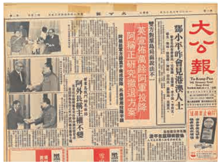
▲一九八二年，鄧小平召見時任《大公報》社長費彝民等十二人，第一次正式提出收回香港主權。圖為相關報道版面