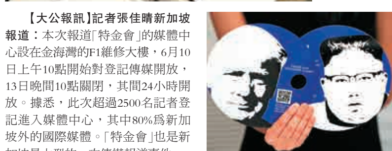
▲峰會媒體中心10日上午對媒體開放

見茶式包羅萬有，除了新加坡當地的叻沙(laksa)和海南雞飯，也有中餐，日式料理，中東菜餚等。大叻報記者避開登記高峰，在10日下午5時許進入媒體中心時，門口並未傳有傳媒長龍等待入場。安保工作有序順暢，入門時保安人員檢查邀請函才放行，隨後檢查隨身攜帶包裹，以及探測身上是否有違禁用品。登記處工作人員也要求記者出示媒體中心發放的E-ticket以及帶照片的身份證明文件。