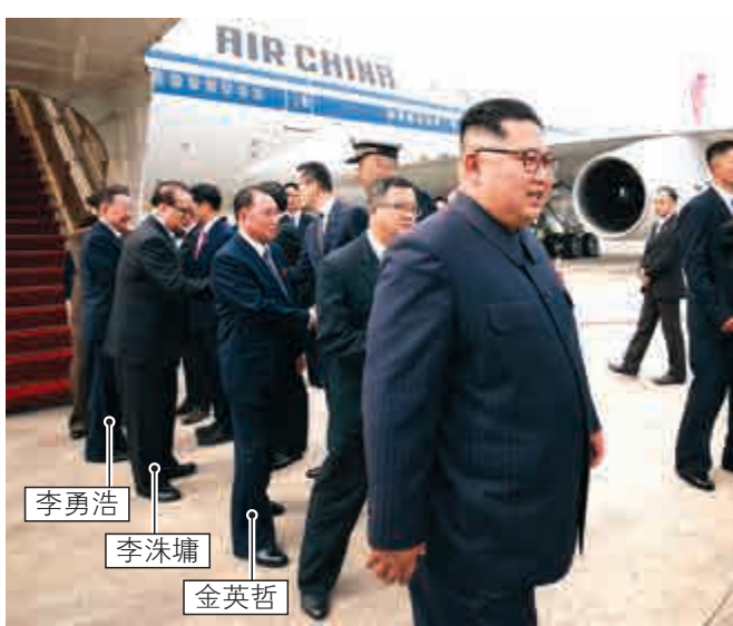
▲金正恩一行10日下午乘中國國航專機抵達樟宜機場