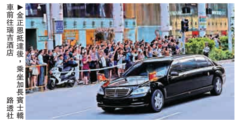
▲金正恩抵達後，乘坐加長版賓士轎車前往瑞吉酒店

與此同時，在戒備森嚴的瑞吉酒店外，聚集了數百名記者和好奇的市民、遊客。大叻報記者在現場見到，瑞吉酒店門口的東陵路兩邊都是高高圍欄，酒店門口有眾多新加坡警員和朝方安保人員。朝方安保人員幾乎是三步一崗，他們統一