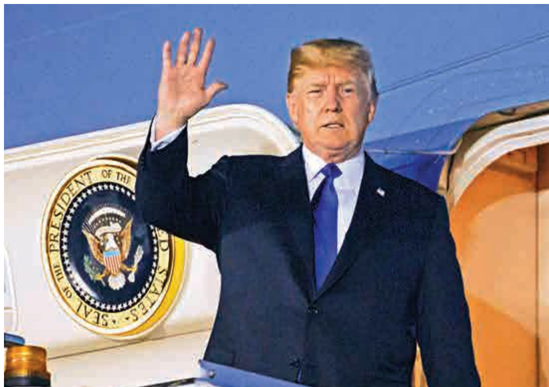
▲特朗普10日晚乘「空軍一號」抵達新加坡