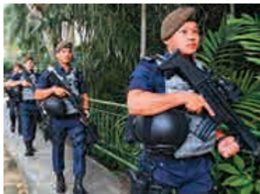
▲星洲警員10日在香格里拉酒店戒備

特朗普專車隨後在晚間9時許抵達新加坡市中心的香格里拉酒店，他預計將在11日會見新加坡總理李顯龍。舉世矚目的「特金會」將於12日上午9時在聖淘沙嘉佩樂酒店召開，目前具體議程未定。此前特朗普稱峰會有可能延續到13日，不過，新加坡媒體報道，金正恩暫定12日中午離開新加坡，而特朗普則預計13日返美。