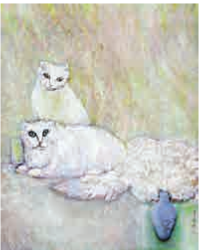
▲蔣勳二〇一八年作《貓》（100×80公分，油彩畫布）