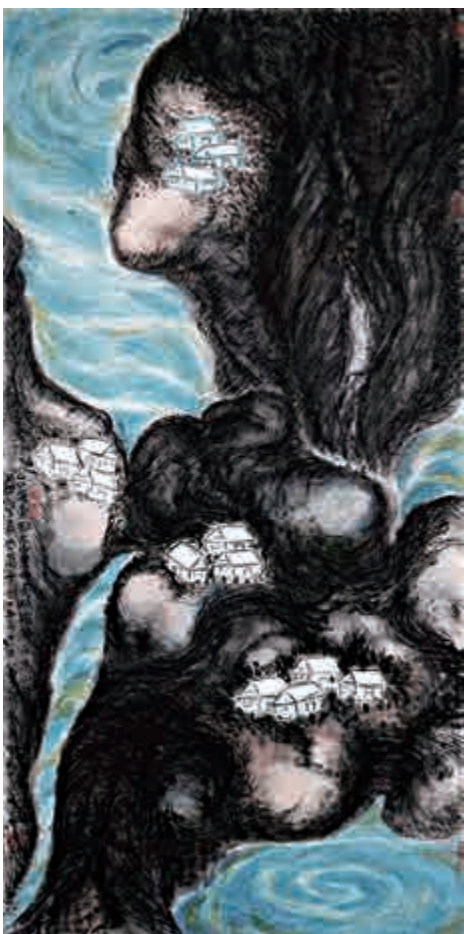
▲蔣勳二〇〇五年作《太魯閣》（132.6×65.7公分，水墨設色紙本）佳士得供圖

►蔣勳二〇一〇年作《只因小小一夢》（28.7×52.8公分，水墨紙本）佳士得供圖