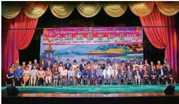
▲演出前主禮嘉賓大合照