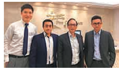
▲松齡護老集團管理層稱，看好高端護老屋市場需求 ▲松齡集團位於元朗的富貴長者屋

舍，主攻內地市場，發展綜合銀齡養生社區，及高端護老院。科技應用方面，該院舍設有自行研發的軟件，在準備餐飲方面，廚師可從電腦上得知每個院友的飲食需要。院友個人病歷資料亦有上載到系統內