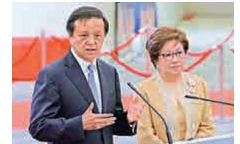
▲左起：港交所行政總裁李小加和主席史美倫

2010年1月16日起出任集團行政總裁兼執行董事，若完成任期，他將會擔任行政總裁一職超過11年，為歷年任期最長的港交所行政總裁。