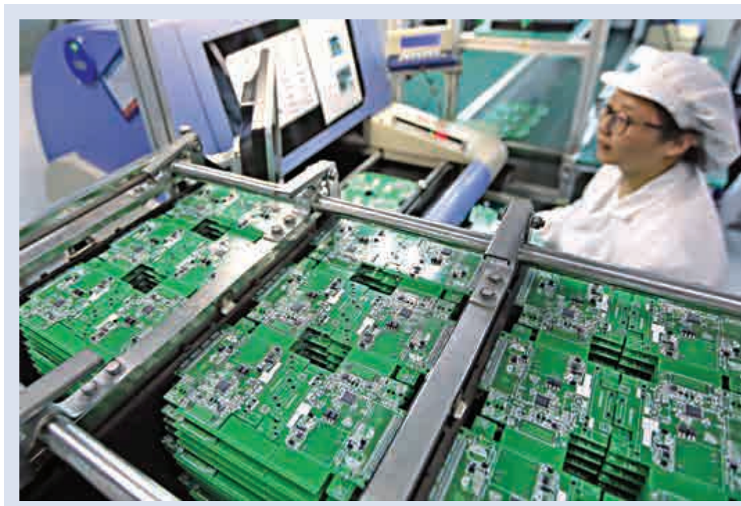
▲浙江杭州智造小鎮將以研發製造「中國芯」及其關鍵設備為產業定位。圖為內地芯片製造企業內的生產景象