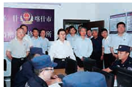
▲國務委員、公安部黨委書記、部長趙克志(後排左五)在喀什市公安局派出所了解基層警力編制和轄區治安情況 網絡圖片