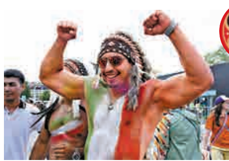
▲大隻佬塗在身上的國旗，一看便知他是墨西哥球迷