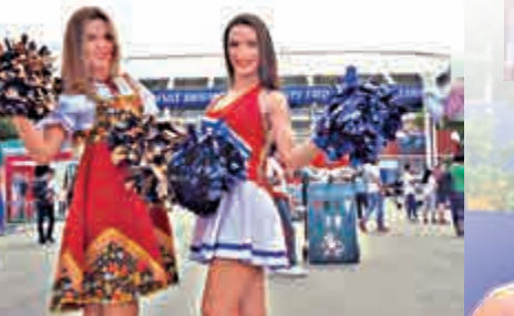
▼雖然裝束不同，但大家都是同一條心，為啦啦隊作出貢獻