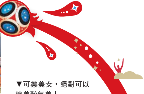
▼可樂美女，絕對可以媲美醇氣美人