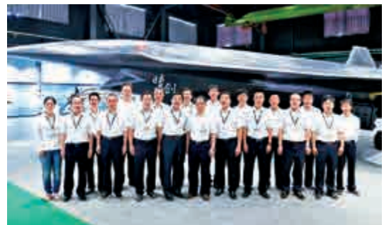
▲網上流傳的「暗劍」等比原型機照片，引起外國媒體強烈關注

公開資料顯示，截至2013年，美軍已經列裝了約8700架無人機和1.5萬個機器人。據羊城晚報報