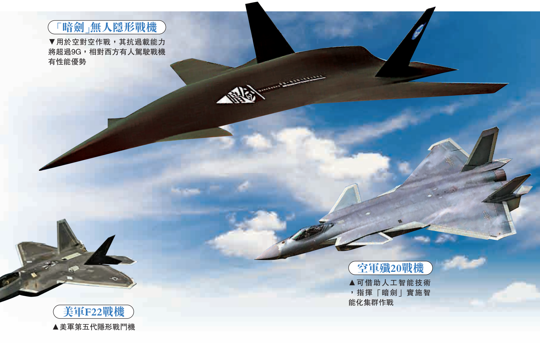
「暗劍」無人隱形戰機

外界報道猜測，「暗劍」還能借助人工智能技術與殲-20協同作戰，以殲-20為核心指揮「暗劍」實施智能化集群作戰。亦有外媒預測，未來「暗劍」有可能攜帶中國最先進空空導彈，具備高超音速飛行能力，對東海、南海的「敵對武器平台」構成致命威脅，提升中國在東海、南海的「區域拒止」能力。