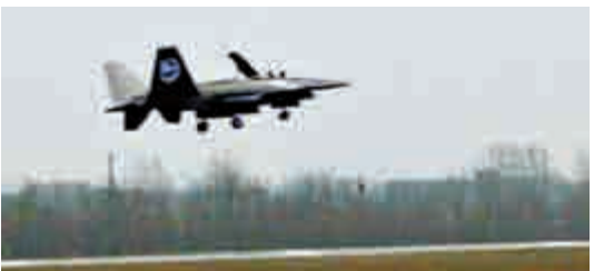
▲疑似「暗劍」無人機試飛照片在網上流傳

，都還需要地面人員的全程操控。談及未來可能出現的六代機，李大光認為，五代和六代的最大區別就在於六代機的自主性更強，即機器可以脫離人的操控，具備自主學習與運行的能力，而五代以下仍必須由人來操控。