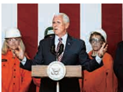
▲美國副總統彭斯(中)19日在紐約州一家鋼鐵廠發表演講 美聯社

地位」。在全球化的今天，各國發展密切相關，甚至休戚與共，這種過河拆橋的做法實不足取，也令人不齒。全球從中國當年四萬億投資中獲益，今天就應客觀理性地看待產能過剩問題，維護國際社會的公正與道義。▲美國副總統彭斯(中)19日在紐約州一家鋼鐵廠發表演講 美聯社