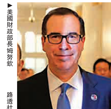
美國財政部長姆努欽

除了特朗普政府準備使用《國際緊急經濟權力法》限制中國投資之外，美國國會也正在推進行旨在加強CFIUS審查力度的法案。該法案還將建立一個新的出口控制系統，以審查海外合資企業是否以不恰當的方式向外國公司轉讓關鍵技術。在前總統奧巴馬主政時期，CFIUS批准中國化工集團收購瑞士種子巨頭先正達。在特朗普上台後，該交易去年獲得了最終的監管批准。據知情人士透露，特朗普政府還擔心CFIUS會遺漏中資參與的風投公司在技術領域的一些小型投資交易，多年後這些交易可能會取得豐厚成果。知情人士稱，2017年春季，情報部門向內閣和白宮官員做了一次簡報，闡述了中國企業如何透過收購、授權和盜竊獲取美國技術，這次會議的影響力尤其大，在一定程度上催生了這些新限制。