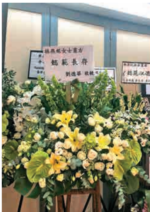
▲劉德華致送的花牌