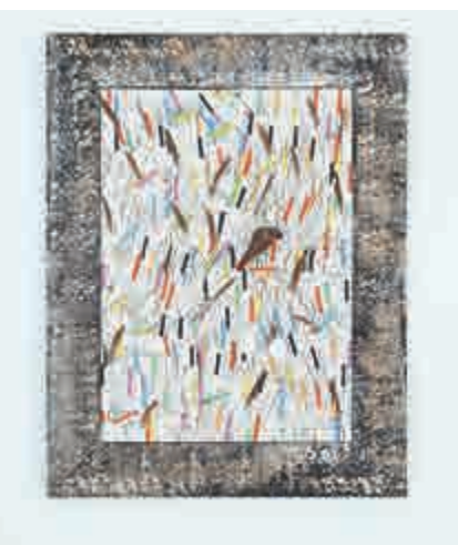
▲《粉筆壁畫》(二〇一五年)

目前定居於比利時的泰歐，於二〇〇二年的第十一屆文獻展以及二〇〇九年的威尼斯雙年展開始嶄露頭角，近期於美國、中國、比利時、意大利、法國等地舉辦個展及群展，如於布魯塞爾BOZAR藝術中心舉辦的個展「迴旋鏢」，於邁阿密巴斯藝術博物館舉辦的個展「美麗」，於穆林常青畫廊舉辦的個展「巫毒孩子」等。