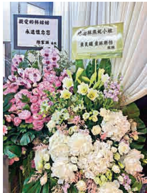
查良鏞夫婦致送的花牌(右)