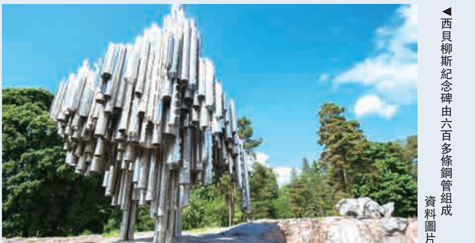
▲西貝柳斯紀念碑由六百多條鋼管組成

，是對新生、自由、幸福的偉大渴求與期盼。樂章一跳，樂聲一變，節奏由沉重突然變得明快暢達，在低音弦樂器一片濃厚的烘托下，銅管樂器和定音鼓帶出一串極刺激極激奮的樂符，讓人振奮，讓人激動，讓人高興，彷彿高山流水，彷彿大江大河，彷彿電閃雷鳴，彷彿春來冬逝。高潮的華彩樂章之後，低音樂器簡約沉穩的聲音漸濃漸淡，漸遠漸近，慢慢之中又呈明快、純樸、厚重、深沉。緊接着，音色渾圓飽滿的木管樂器再次奏出一種必勝的信心，一種必得的信心，一種撥雲見日的豁然，勝利的頌歌、樂章隱隱作響，似勝利在大勢磅礴氣度非凡中誕生。最後的頌歌莊嚴舒緩，神聖的光明已經降臨，那就是芬蘭民族的驕傲、芬蘭民族的象徵、芬蘭民族的追求、芬蘭民族的勝利。我想起了中國的《黃河大合唱》，想起了冼星海，想起了回響在抗日烽火前線、後方的《黃河大合唱》。那時候的八路軍戰士、抗日軍民，誰不會唱幾嗓子《黃河大合唱》中的歌曲呢？「風在吼，馬在叫，黃河在咆哮，黃河在咆哮，河西山崗萬丈高，河東河北高粱熟了，萬山叢中，抗日英雄真不少，青紗帳裏，游擊健兒逞英豪！」我們中國人就是唱着這支歌「保衛家鄉，保衛黃河，保衛華北，保衛全中國」的！可惜，出師未捷身先死，冼星海一九四五年十月三十日病逝於莫斯科，僅活了四十歲，還不到西貝柳斯壽命的一半。