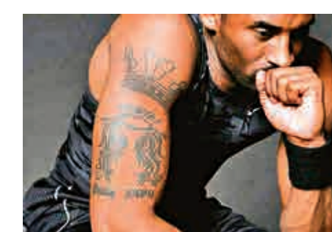
▲紋身須謹慎考量 資料圖片

價便一定有好服務，但你真的放心只看價錢嗎？而且，儀器可能與血液接觸，對衛生的要求必須非常嚴謹，部分國家甚至有條例規定紋身師定期驗血。再者，紋身除了是藝術，也是紋身師賴以維生的專業技術。假若你理解設計師、攝影師及舞蹈員等應該得到合理工資，而不是社交平台一次讚好或分享便足以支付，那麼你也應該明白紋身師也要吃飯。