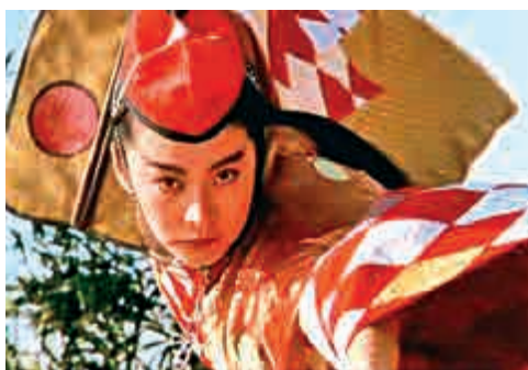
▲林青霞飾演的「東方不敗」已成銀幕經典

對於我來說，其東方不敗的形象至關重要，在我的著作中，我用了整整一個書章談論這位跨性別的易服男主角。男主角為何須以「奪命佳人」的姿態出現呢？當年電影首輪放映，我是窮學生一名，很不容易省下錢來買票看戲，結果發現電影過了一半，林青霞仍是男裝打扮，看下去才知道林青霞的確是演男角 (即反串)，我就崩潰了。意料之外，沒多久林青霞