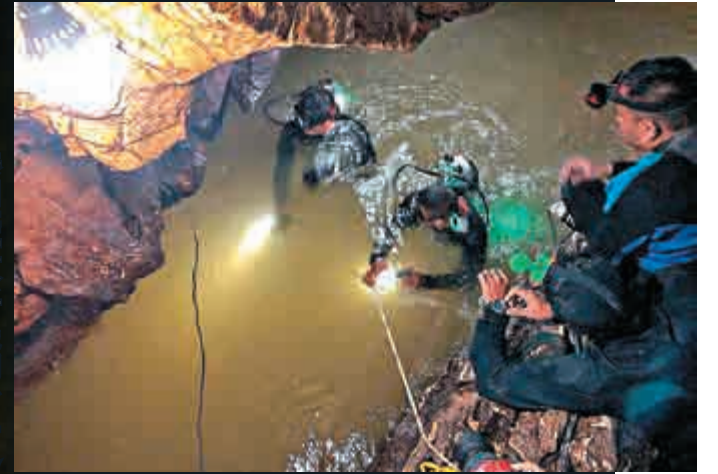
泰國海軍蛙人6月29日潛入洞尋人

【大公報訊】綜合美聯社、法新社、泰國《民族報》報道：在泰國當局和國際社會千人員連日搜救之下，在泰北洞穴失聯10天的泰國少年足球隊的12名隊員和教練，2日晚間終於找到了。泰國當局表示，預計最快在3日深夜開始，將他們轉移到洞內的安全地帶。由於泰國正值雨季，洞內水位高漲不退，受困少年可能要在洞中待上數月才能重見天日，更有可能需要接受潛水訓練，救援人員已為他們準備了四個月糧食。