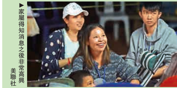
家屬得知消息之後非常高興