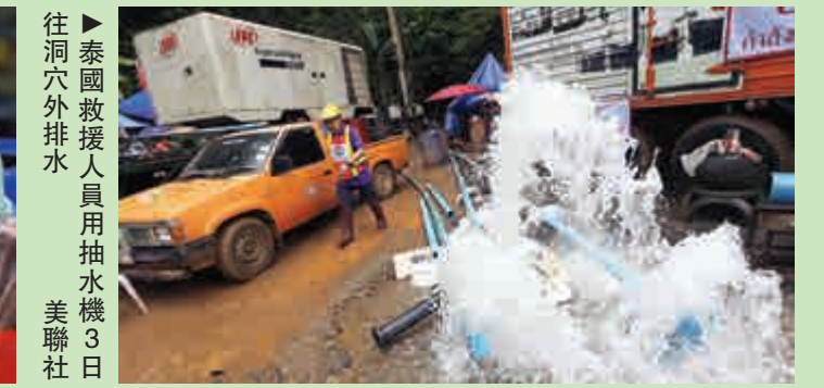
泰國救援人員用抽水機3日往洞外排水

來自泰北清萊府一所學校「野豬」足球隊的12名少年運動員和一名男教練，從6月23日進入清萊府境內國家公園的「拷龍穴」（也稱「睡美人洞」）內「探險」，隨後遭洪水圍困。連日來，包括泰國、中國、美國等國的多支救援隊一千多人展開晝夜搜救行動，在當地時間7月2日晚，終於傳來好消息。