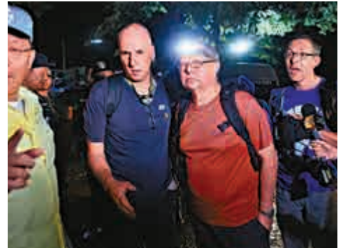
英國潛水救援專家斯坦頓（左二）和沃蘭森（右）

斯坦頓18歲時受了電視節目啟發，為了探索洞窟開始學習潛水。斯坦頓還曾在2004年前往墨西哥，救援因為水位上漲而受困岩洞的英國洞穴探險者，讓6名受困者穿上潛水裝備後，一一將他們帶出，救援工作共耗費6小時。斯坦頓在2013年因為參與搜救工作而獲頒大英帝國勳章（MBE）。