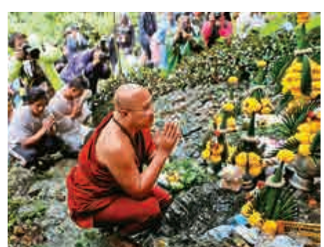
一名僧人27日在洞穴外為失聯的足球隊員做法事

被國王派出的軍隊殺害。公主悲痛欲絕輕生，據傳公主的鮮血變成了水流，而身軀則化作群山，因此該洞穴得名為「睡美人洞」。由於距離該洞口不遠處就是祀奉該公主的小廟，有當地居民相信，可能是少年足球隊員進入洞穴時，觸怒了公主亡靈。家屬們連日守候在洞口外，準備水果、零食、飲料等供品，更請來僧人作法，盼望親人可平安歸來。