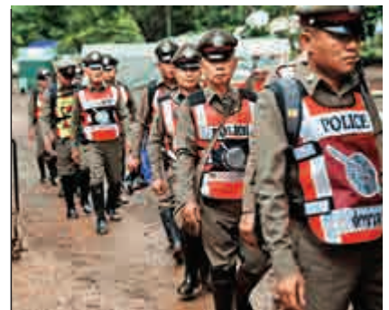
泰國警方3日進入現場協助搜救

13名受困者的命運，牽動全泰國人民的心。泰國總理巴育2日晚在一份聲明中說，泰國政府和人民感謝國際社會提供的支持和合作，失聯人員全部安全，是所有人團結一心的美好結果。泰國國民紛紛在推特上對各國救災英雄表示感謝。