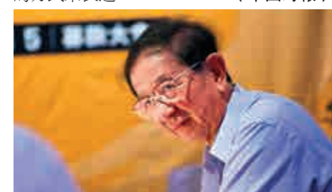
▲李遠哲被指台灣「學術崩壞」的始作俑者 網路圖片