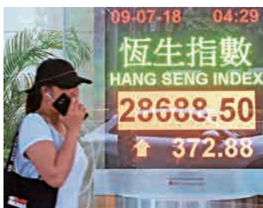
▲港股延續上周五升勢，全日升372點，收報28688點

就內地有傳推遲理財新規發布日期，德銀發表報告稱，若屬實料可緩和市場對內地去槓桿的憂慮，內銀可受惠，指出內地透過推行金融改革，可降低行業長期性金融風險，有利提升盈利增速。首選農業銀行(01288)、建設銀行(00939)及郵儲銀行(01658)，昨日分別上升0.8%至約2%。