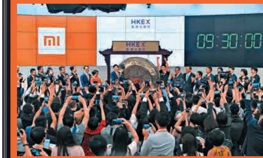
本港首間以「同股不同權」形式上市的小米昨日成功在港交所掛牌