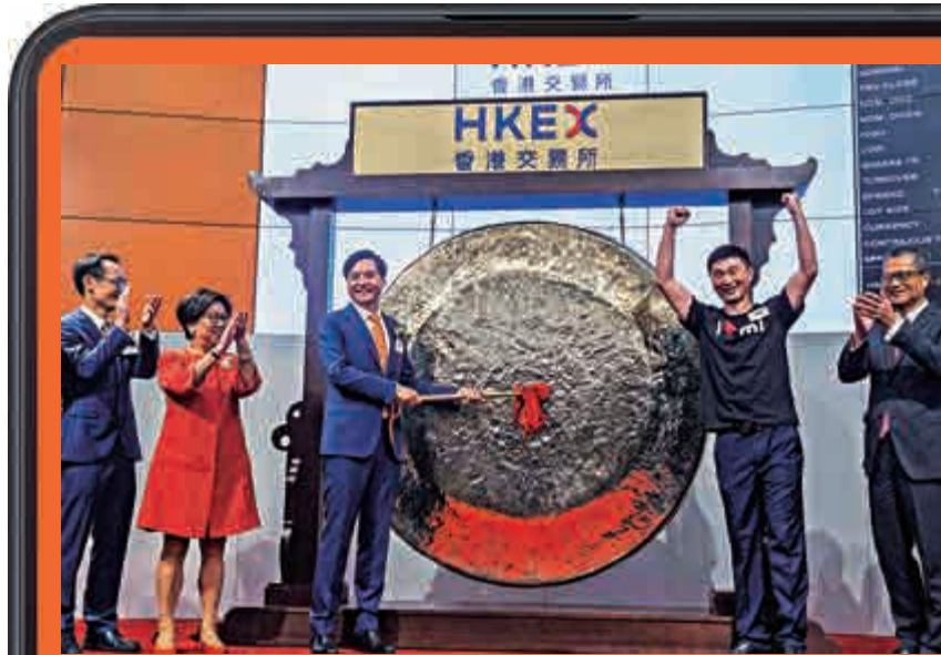
雷軍昨日敲響二百公斤新銅鑼

另外，由於小米符合恒生綜合指數的快速納入指數規則要求，相關指數的成份股將於本月20日收市後有變動，並於本月23日起生效。換言之，小米最快本月納入港股通名單。小米將被納入下列指數及其分類指數，包括恒生綜合指數(恒生綜合行業指數、資訊科技業、恒生綜合大型股指數、恒生綜合中大型股指數)、恒生環球綜合指數、恒生互聯網科技業指數。