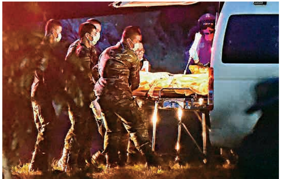
▲一名重獲自由少年9日被送上救護車