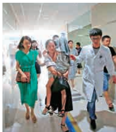
▲一名布吉船難幸存女孩8日被抱回浙江

此外，由於「睡美人」地下洞穴曲折複雜，有醫生擔心他們身體上也有創傷。長達十多天未見天日，這群少年可能迷失方向感，也有可能暫時無法正常入睡。由於缺乏睡眠和營養不良，他們的免疫系統也相對較脆弱，如果被困期間糞便等排泄物沒有正常處理，少年們也有可能暴露在致命感染中。