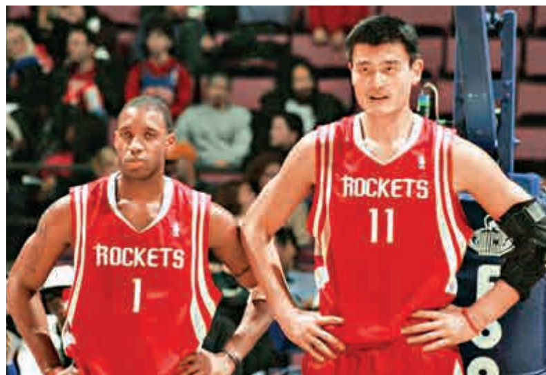
▲姚麥組合曾是火箭隊的靈魂

果不其然，賽季初的幾場比賽中，儘管火箭的戰績依舊強勢，但麥迪的步履愈顯沉重，受制於肩傷而幹拔不再輕盈，他更多是選擇在場上散步以此為自己在進攻端保留盡可能多的體能。然而，他的投籃命中率及罰球命中率仍然不可避免地出現大幅下滑，狀態起伏自然影響到了球隊的正常運轉與輿論對他