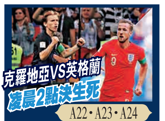
克羅地亞VS英格蘭 凌晨2點決生死