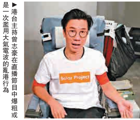
曾志豪在直播節目中爆粗或濫用大氣電波的亂港行為