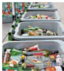
玻璃樽徵費最快明年年中前全面實施

至於徵費具體安排，環保署表示，供應商須向署方作出登記，並每季呈交玻璃樽「分發」或「耗用」情況，按季繳付徵費。署方擬要求供應商在每季繳付徵費的28天作出申請；收到繳付通知書30天內繳款。