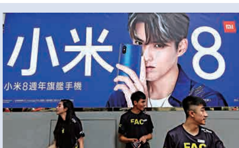
小米下周一正式納入富時中國50指數，股價昨日大升逾一成。