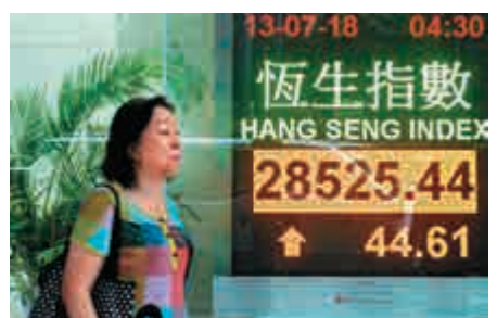
▲港股昨日曾漲逾200點，收市微升44點

內需股冠絕全場，獲瑞信唱好的蒙牛乳業(02319)領漲，以全日最高26.7元收市，抽升逾5%，是升幅最大的藍籌股。緊