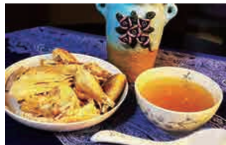
▲台山「燉雞汁」，剛撈起的雞肉可和雞汁一起食用

如今，隨著電商時代的到來和出國簽證的便利，越來越多的南北食材和外國食材豐富着人們的餐桌，各種較具特色的湯品