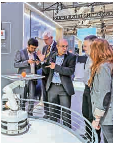
▲德國漢諾威工業博覽會上，中國公司展台的機器人吸引參觀者 資料圖片

然而，歐洲政治並不穩定，格局轉變的烏雲正浮起在地平線上。待到歐盟換屆之後，歐洲對待中國的總體態度究竟會怎樣，仍需拭目以待。中國在美國和歐洲之間的縱橫捭闔，使中美歐戰略三角關係更加微妙。此前李克強總理的歐洲之行，以及接下來的中歐領導人會晤，將對世界經濟體系和國際戰略格局產生比以往任何時候都更為深遠的影響。