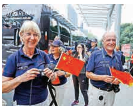
▲7月6日，56名坐大巴從漢堡出發的德國文化使者歷時53天抵達上海

上月底，商務部新聞發言人高峰在第七次中歐經貿高層對話結束後的記者會上表示，中歐雙方在對話中達成了一系列重要共識和豐富成果，將為全球經濟持續復甦和穩定發展帶來一股「暖流」，亦為第20次中歐領導人會晤在經貿領域做了充分準備。高峰介紹，中歐投資協定談判將於近期舉行第18輪談判。此次中歐經貿高層對話中，雙方表示，爭取在第20次中歐領導人會晤期間，交換市場准入清單出價。隨着雙方完成清單出價的交換，中歐投資協定談判將進入新的階段。