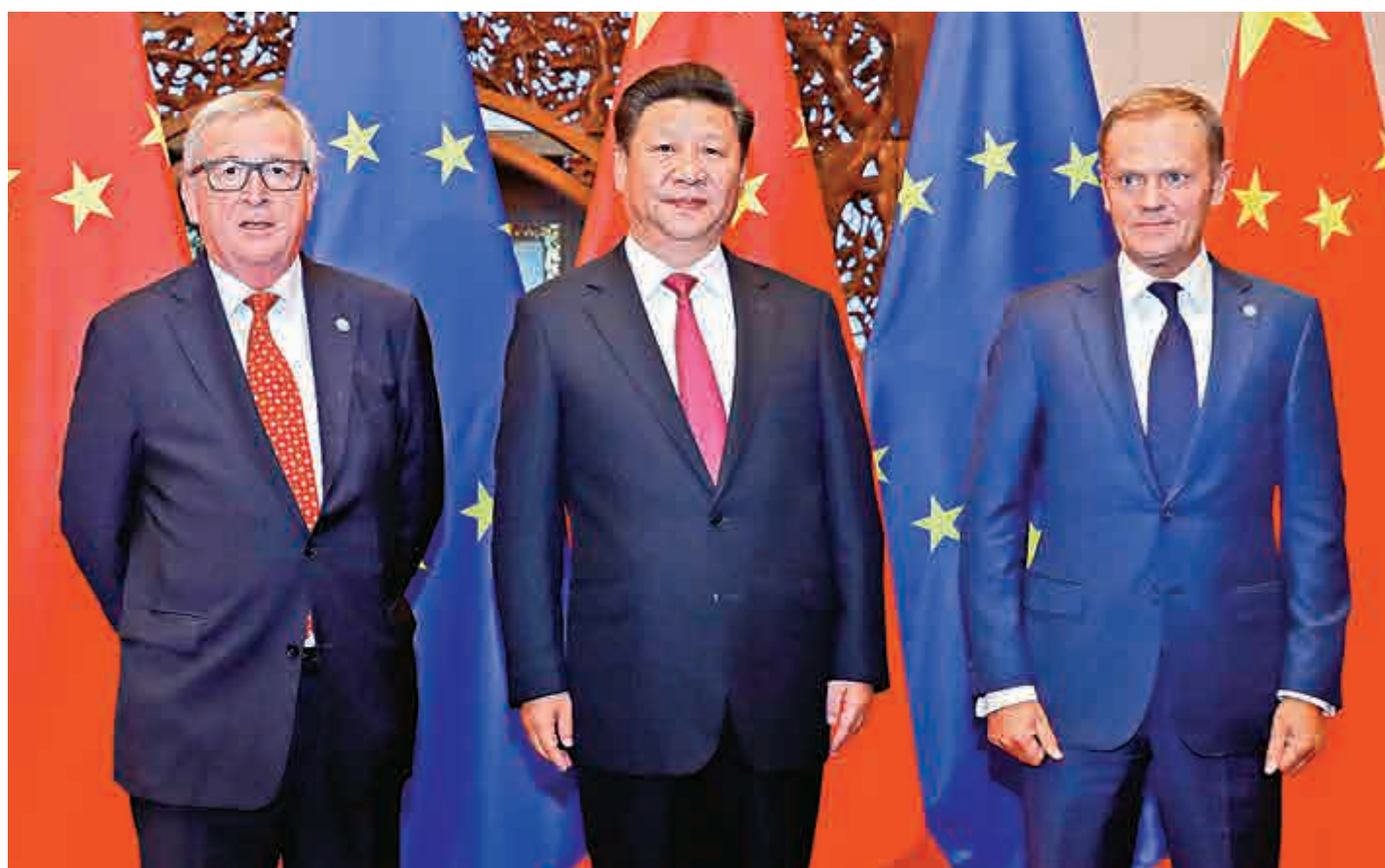
▲習近平將於第二十次中歐領導人會晤中會見歐盟領導人。圖為2016年7月12日，習近平會見出席中國歐盟領導人會晤的歐洲理事會主席圖斯克（右）和歐盟委員會主席容克（左）