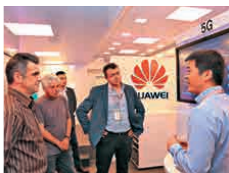
▲華為工作人員向幾位保加利亞客戶介紹5G網絡技術

【大公報訊】據新華社報道：華為技術公司與馬耳他政府14日簽署合作諒解備忘錄，旨在利用華為5G技術幫助馬耳他啓動智慧城市建設。在當天舉行的簽署儀式上，華為意大利公司負責人繆曉陽表示，5G技術可以提供更寬的帶寬，實現更多的連接，提供了構建智慧城市、智能型社會、智能化產業的數字技術基礎。「通過這項合作，華為幫助馬耳他開啓了建設智慧城市的里程。」