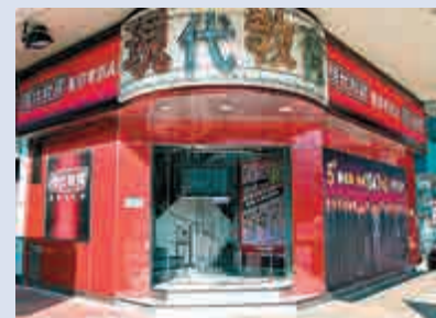
▲現代教育於兩個月內再有「補習天王」遭廉署起訴 ▲英文科名師劉冠華（Kris Lau）以「命中貼題」作宣傳