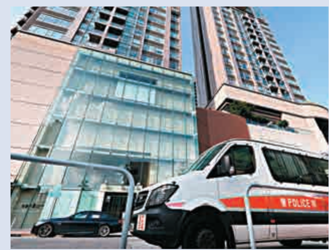
▲揭發雙屍命案的紅磡昇御門

現場消息指，發生雙屍案的單位，建築面積900多平方呎，實用面積逾700平方呎，三房兩廁設計。該單位於2013年，由一間公司以1100萬元購入，該公司唯一女董事姓馮，公司登記地址是港島南區豪宅貝沙灣第二期南岸一單位。資料顯示，與命案單位相同、但較低層的三房單位，上月以1400萬元售出，樓價較業主當年購入時升值約24%。