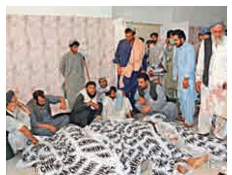
▲大選當日的炸彈襲擊造成至少31人死亡，70人受傷