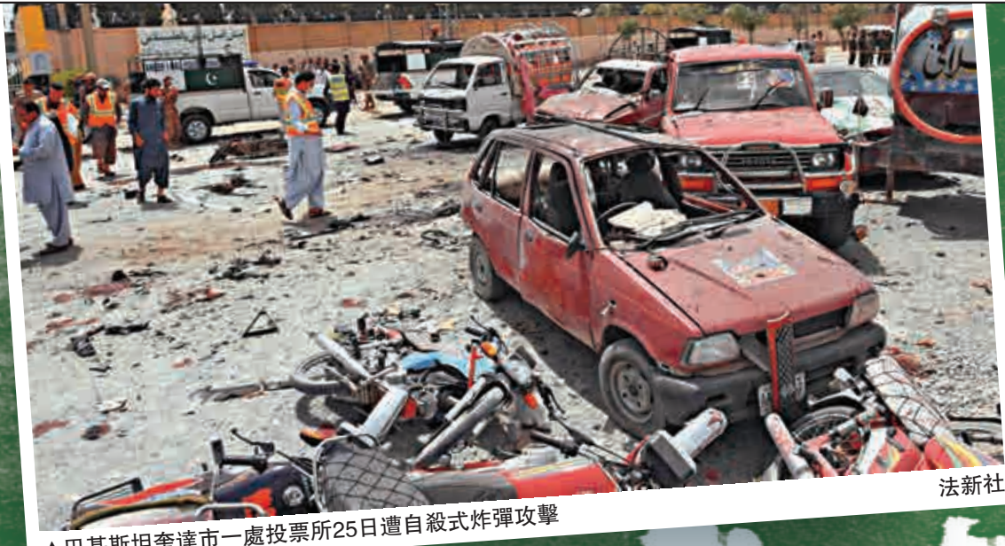
▲巴基斯坦奎達市一處投票所25日遭自殺式炸彈攻擊