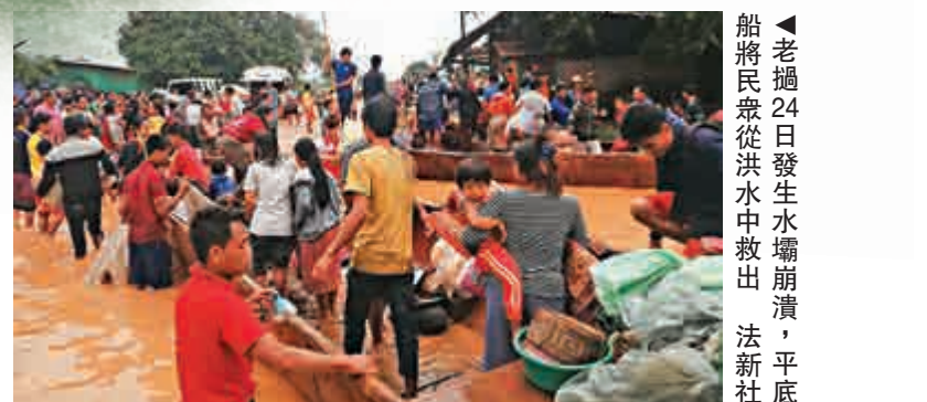
▲老撾24日發生水壩崩潰，平底船將民衆從洪水中救出

斯瓦爾巴居民有個Facebook群，專門用來追蹤北極熊。早前，這個群用來標示北極熊出沒的地點，提醒居民避開高危險區。但現在，當地人會在收到信息後，專門開船到北極熊出沒地去看牠。