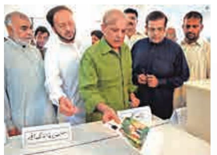
▲穆斯林聯盟領導人夏巴茲·謝里夫(中)在投票站

【大公報訊】綜合法新社、美聯社及英國《衛報》報道：巴基斯坦25日舉行大選，同時選舉國民議會和省議會，並在此基礎上組建中央和地方政府。此次大選選情複雜激烈，前板球明星出身的政客伊姆蘭·汗成為「第三勢力」，向兩大傳統政黨發起有力挑戰。大選當天巴國安全局勢緊張，極端組織「伊斯蘭國」(ISIS)針對票站發動襲擊，造成至少31人死亡及70人受傷。