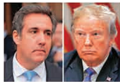
▲美國總統特朗普(右)及其前私人律師科恩(左)