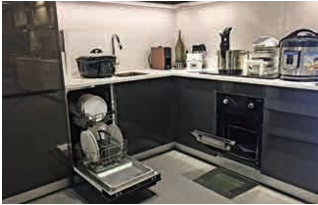
▲迷你版嵌入式廚櫃及電器，闊度由60厘米大幅「縮水」至45厘米

樓價高企，「納米樓」湧現，香港人愈住愈細，愈住愈貴，起居飲食受局限，就連傢俬與家居電器，也要隨着「新常態」的狹窄居住環境而「進化」。有80後夫婦慨嘆，蝸居「容得下二人，容不下家電」；租住納米樓的90後年輕人說，受住所空間所限，電器「一味要細」。集多功能於一身的迷你家電、俗稱「變形金剛」的可開合傢俬，應運而生，就算售價貴一些，對小單位的住戶來說，慳位更重要，如玩俄羅斯方塊一樣，見位就「攝」，務求用盡空間每一寸，才是王道。