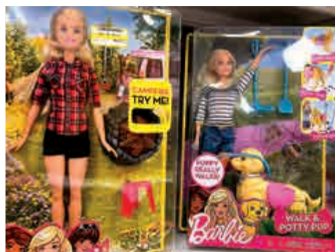
▲美泰稱裁員後，每年將可節省約1.5億美元，圖為旗下產品芭比娃娃

【大百報訊】記者鄭芸央報導：玩具商美泰（Mattel）公布第二季度業績，期內錄得虧損2.409億美元（約18.79億港元），虧損較上年同期的5610萬美元更大，銷售額按年減少14%，至8.407億美元。