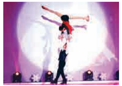
▲冰秀表演者正上演一場浪漫的雙人花式滑冰

「我們現在練功不像以前，雜技發展得非常科學」，領隊說會根據每個孩子身體的柔軟度，度身定做適合的訓練方法。訪問完畢，她和一眾學員又旋即重返冰雪舞台，努力為未來的「一帶一路」巡迴演出做好準備。