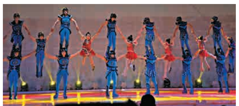
▲冰秀疊羅漢考驗團體合作，演員之間相當默契