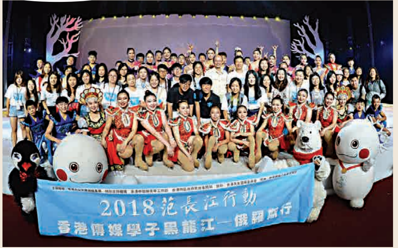
▲「范長江行動」香港傳媒學子與冰秀演員們合影