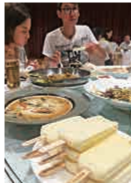
▲盤裝當地特色馬迭爾冰棍，港生大呼過癮

除了量大味美的當地美食，就餐的百年老店也大有來頭。哈爾濱友誼宮原名「中國中蘇友誼宮」，有悠久的歷史文化，是哈爾濱市標誌性建築之一。賓館外觀是中西合璧的宮殿式建築群，庭院內的景致