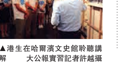
▲港生在哈爾濱文史館聆聽講解

港生表示能接觸文史館的珍貴史料實在難得，與鄭教授的互動加深了他們對建國史的認識。