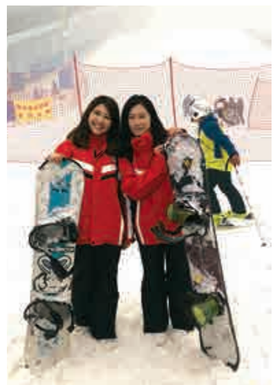
▲港生在冰雪世界嘗鮮滑雪

記者走訪發現，室內滑雪場吸引了不少專業滑雪隊前來訓練。北京的朱同學已有一年滑雪經驗，趁着暑假的空檔和自己的滑雪隊專程來到哈爾濱，目前已訓練一周。「