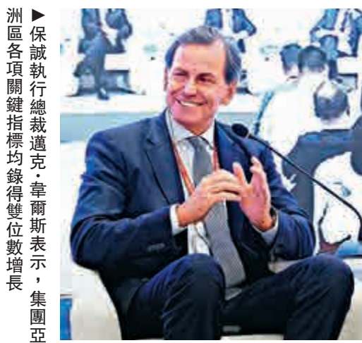
▲保誠執行總裁邁克·韋爾斯表示，集團亞洲各項關鍵指標均錄得雙位數增長

麗新系股價昨日全線下挫，主角豐德麗股價跌0.775%至每股1.28元，私有化價格已較股價有0.02元溢價。麗新發展股價跌0.912%至每股13.04元收市，低於私有化公布後首個交易日的13.26元收市價。麗豐股價則跌1.636%至每股10.82元。麗新製衣股價亦跌0.179%至每股11.18元。