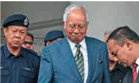
▲馬來西亞前總理納吉布（中）面色沉重離開吉隆坡法院

在審前聽證會中，檢方說納吉布的私人銀行帳戶在2014年和2015年，接收了三筆來自SRC國際公司共計4200萬令吉（約8090萬港元）的轉帳。檢方認為這些錢屬於非法收益，違反了馬來西亞反洗錢、反恐怖主義融資及非法活動收益法的條例。若這三項指控中的任何一條成立，納吉布都可被判高達15